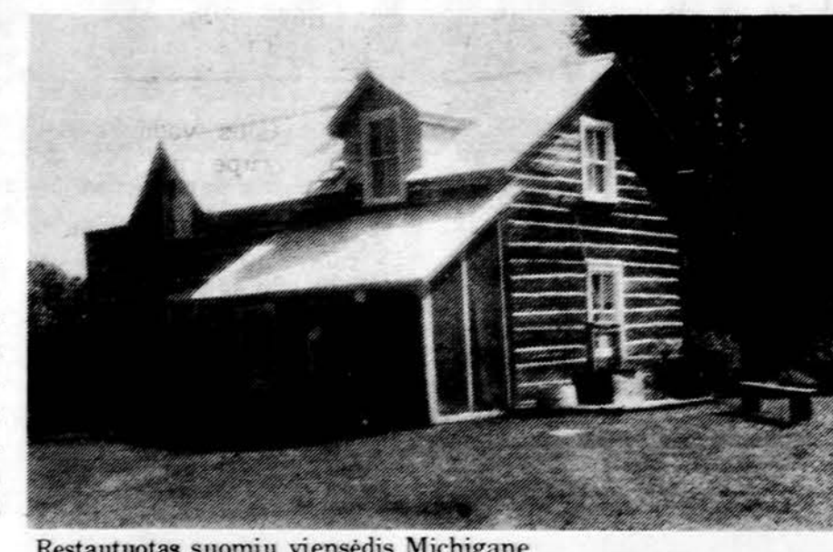
Restauruotas suomių viensėdis Michigane.