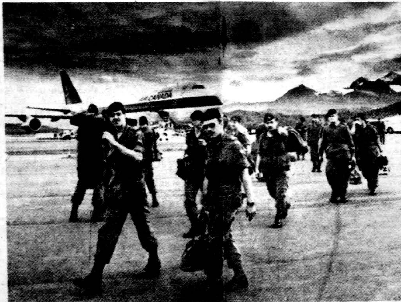
Kanados kariai atvyko į Norvegijos Bardufoss aerodromą dalyvauti NATO pajėgų kariniuose veiksmuose, kurie tęsis visą mėnesį. 5,500 Kanados karių atlieka įvairių ginklų rūšių pratimus.

- Paryžiuje antrą kartą savaitės laikotarpyje sprogo bomba ir sužeidė 41 žmogų. Policijos žiniomis, tai solidarumo komiteto su arabais padarinys.