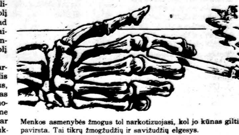
Menkos asmenybės žmogus tol narkotizuojasi, kol jo kūnas giltine pavirsta. Tai tikrų žmogžudžių ir savivžudžių elgesys.