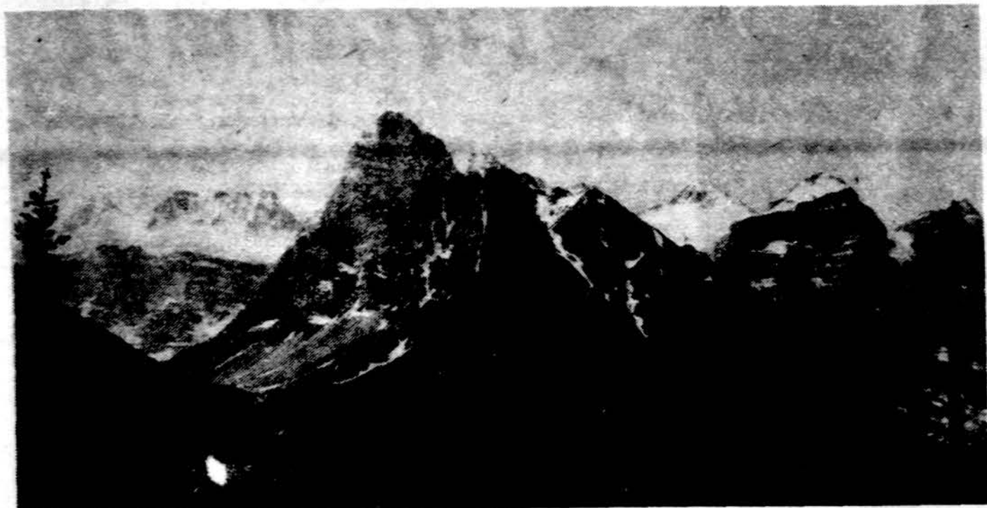
Dešimties kalnų slėnis, Banff nacionaliniam parke, Kanadoje.