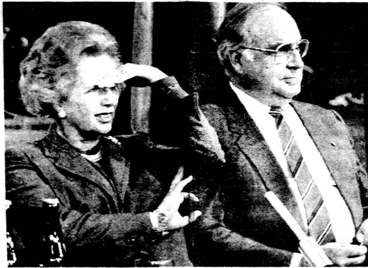
Britanijos premjerė Margaret Thatcher ir Vakarų Vokietijos kancleris Helmut Kohl spaudos konferencijoje pareiškė savo abejones sankcijų Pietų Afrikai reikalingumą.