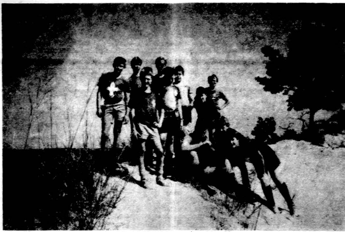
Būrelis JAV Vidurio rajono stovyklautojų išskyloje.