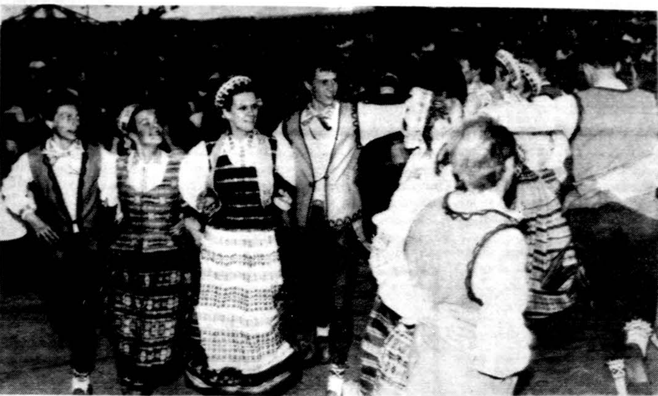
„Grandinėles šokėjai viename pasirodyme. “