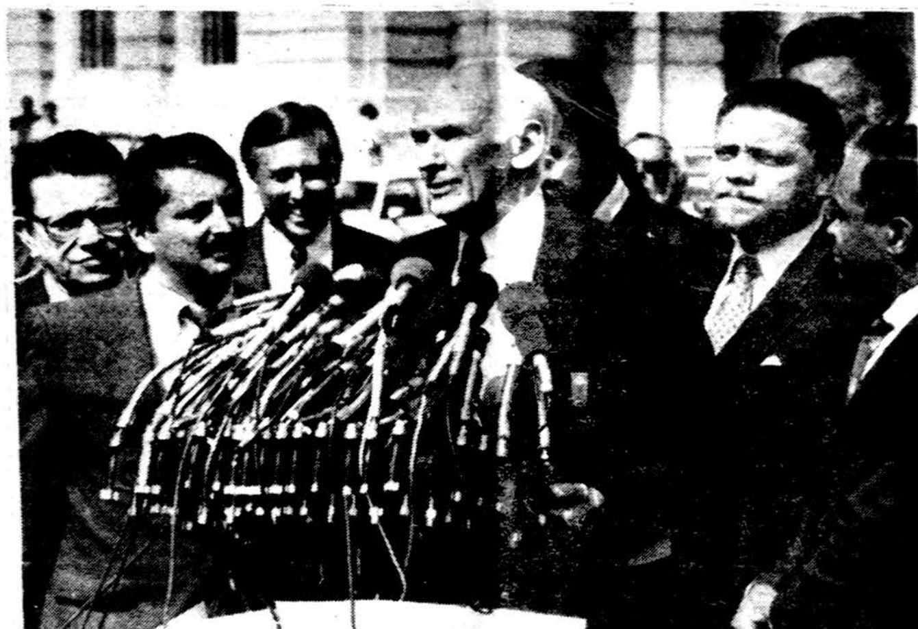
Demokratų įstatymų leidėjai, kurie balsavo už sankcijas Pietų Afrikai, spaudos konferencijoje. Iš kairės: Illinois sen. Paul Simon, Connecticuto kongr. Sam Gejdenson, Maryland kongr. Steny H. Hoyer, kalba Californijos sen. Alan Cranston, Pensilvanijos kongr. William H. Gray, užstotais, Texas kongr. Mickey Leland, Californijos kongr. Ronald V. Dellums, užstotais, ir Columbijos distrikto delegatas Walter E. Fauntroy.