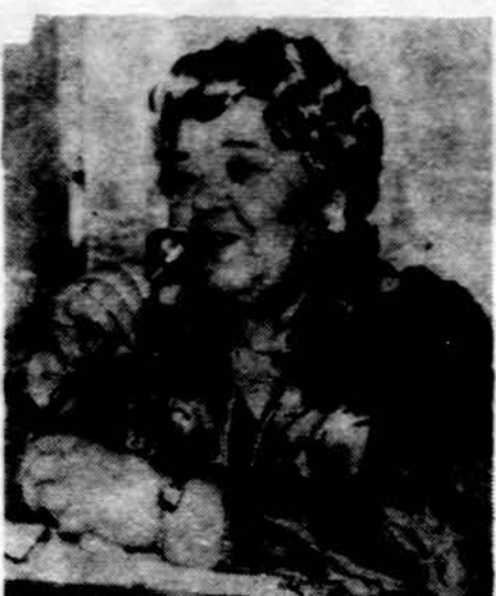
Gail. sesuo Ona Ankienė Alvudo pažmonyje Lietuvos sodyboje nuotakingai perduoda savo patirtį kvadant alkoholiukus jiems skirtoje ligininėje.

Išvada. Kol žmonės reikiamai apsisviečia, jie gerokai paklaidžioja ilgais mediciniškais šunkeliais. Tabaka irgi pradžioje buvo laikoma vaistu nuo daugelio ligų — net pusėje puslapio netilpo tų ligų pavadinimai. Dabar nuo vėžio žmonės gydosi neveikliais vaistais, nepaisydami specialistų perspėjimų. Panašius takus mynė ir kokainas, kol pagaliau savo vietą rado: dabar jis naudojamas vietinėje anestezijoje. O