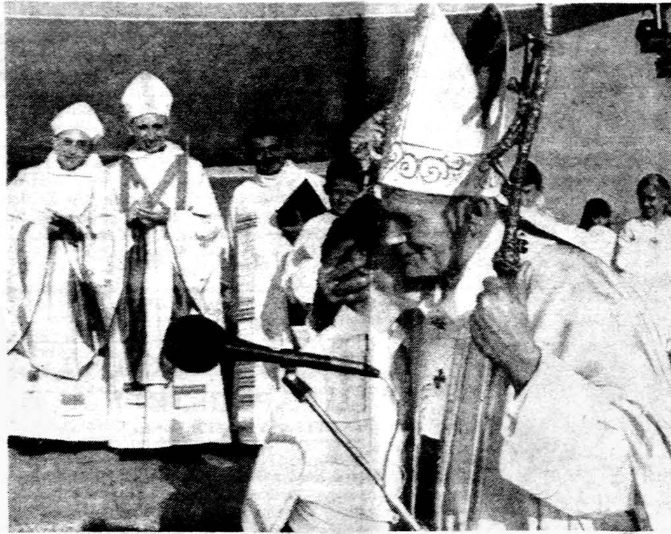
Popiežius Jonas Paulius II priglaudžia berniuką, kuris kalbėjo prancūzų vaikų vardu atidarymo ceremonijose prieš pradėdant celebruoti šv. Mišias Lyono mieste, Prancūzijoje.

— Edward Perkins yra nominuotas būti ambasadoriumi Pietų Afrikoje. Tai būtų pirmas juodosios rasės žmogus atstovaujantis JAV toje valstybėje. Jesse Jackson ragino jį atsakyti to posto, nes jo nuomone tai būtų lyg „prašyti žydą būti pasiuntiniu tarp Hitlerio ir reaktionieriškos administracijos“.