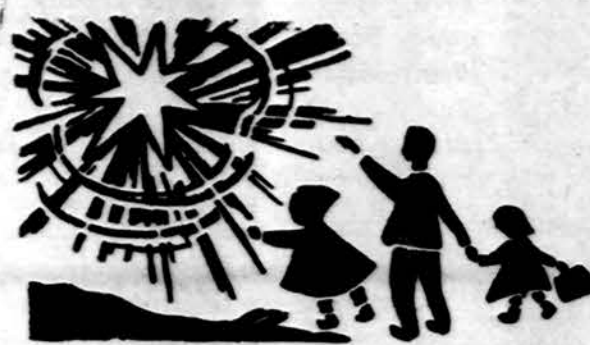
Redaguoja J. Placas. Medžiagą siųsti: 3206 W. 65th Place, Chicago, IL 60629

x Kelionė laivu! Amerikos Lietuvių Tautinė sąjunga organizuoja kelionę laivu. Vasario mėn. 7-14 d., į Vakarinę Karibių jūrą. Registravimas — dar yra vietų papigintom kainom. Galima kreiptis pas Vidą — Ambers Travel Service, 11745 Southwest Hwy., Palos Heights, Ill. Tel. 312-448-7420. (sk.)