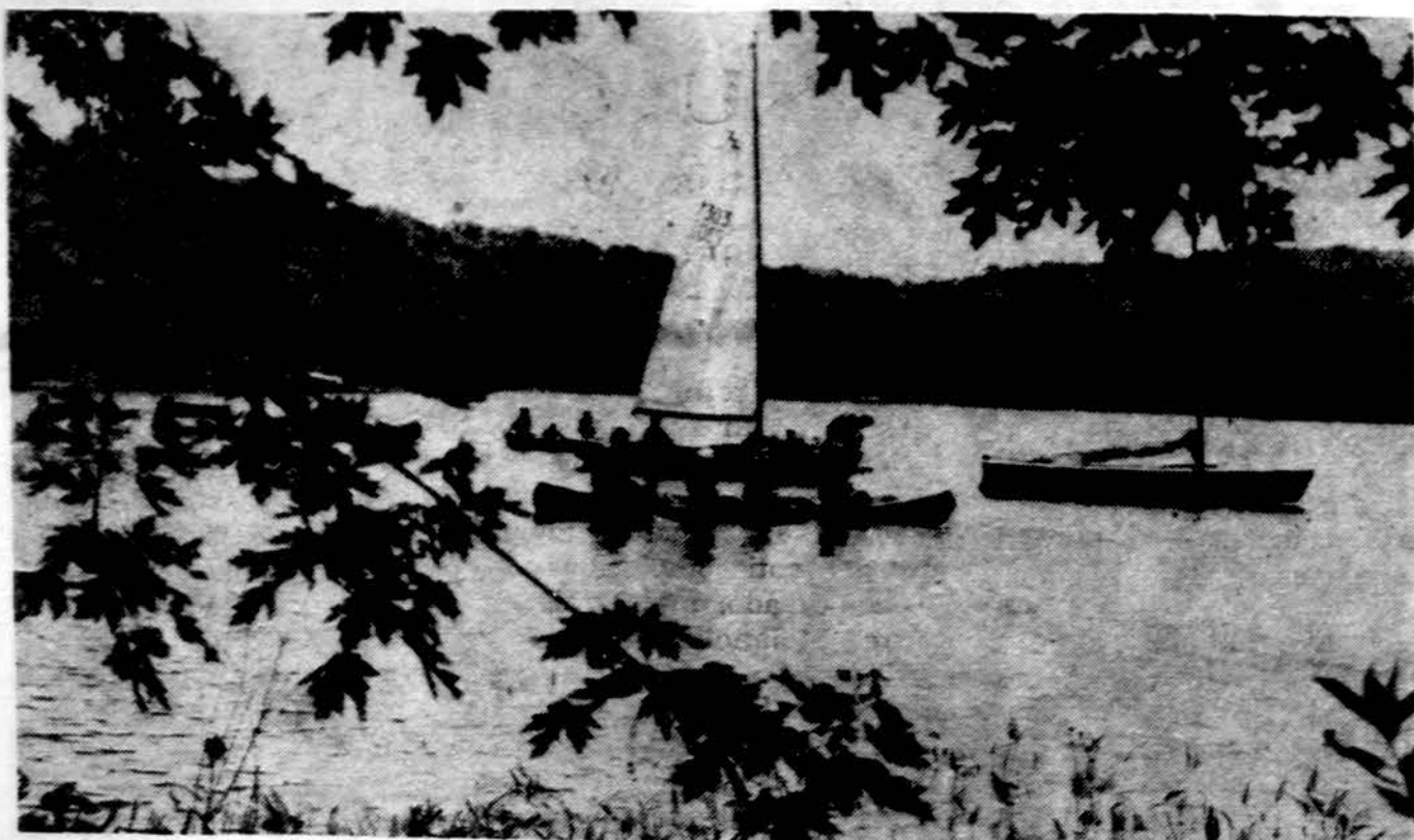
Užsiėmimai buriavimo stovykloje.

Toji audra palietė taip pat ir visą stovyklą, nes stovyklautojai buvo „mandresni“ už brolių Vaciuoką — nepaklausė kaip teisingai laivus užinkaruoti. Vėtra beveik sugriovė lieptą ir gerokai apdaužė laivus. Buvo pati geriausia pamoka: klausyti vadovų!