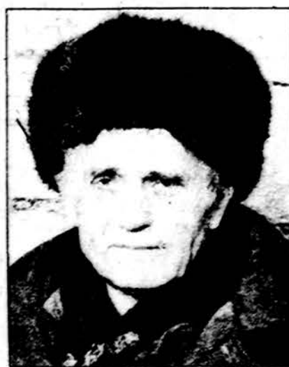
Žmogaus teisių gynėjas Yuri Orlov.

Orlovas, kalbėdamas su reporteriais po vizito pas prezidentą, pasakė, kad jie kalbėjosi apie taikos problemas, saugumą ir kaip tos problemos yra susijusios su žmogaus teisėmis. Jis sako, kad prašė prezidentą kalbėti su Gorbačiovu apie Sacharovo, kuris laikomas Gorky mieste, ir apie Antolijū Marčenko, ukrainiečių žmogisčių teisių gynėją, dabar laikomą darbo lageryje. Orlovas, pats išgyvenęs 5 metus Sibiro darbo koncentracijos stovykloje, prezidentui paliko gilų įspūdį, apie kurį prezidentas išsireiškė, kad „Vakarai yra jam daug skolingi už jo drąsą ir už jo nepalaužiamą kovą už žmogaus teises ir laisvę, kurių mes kartais nevertiname“.