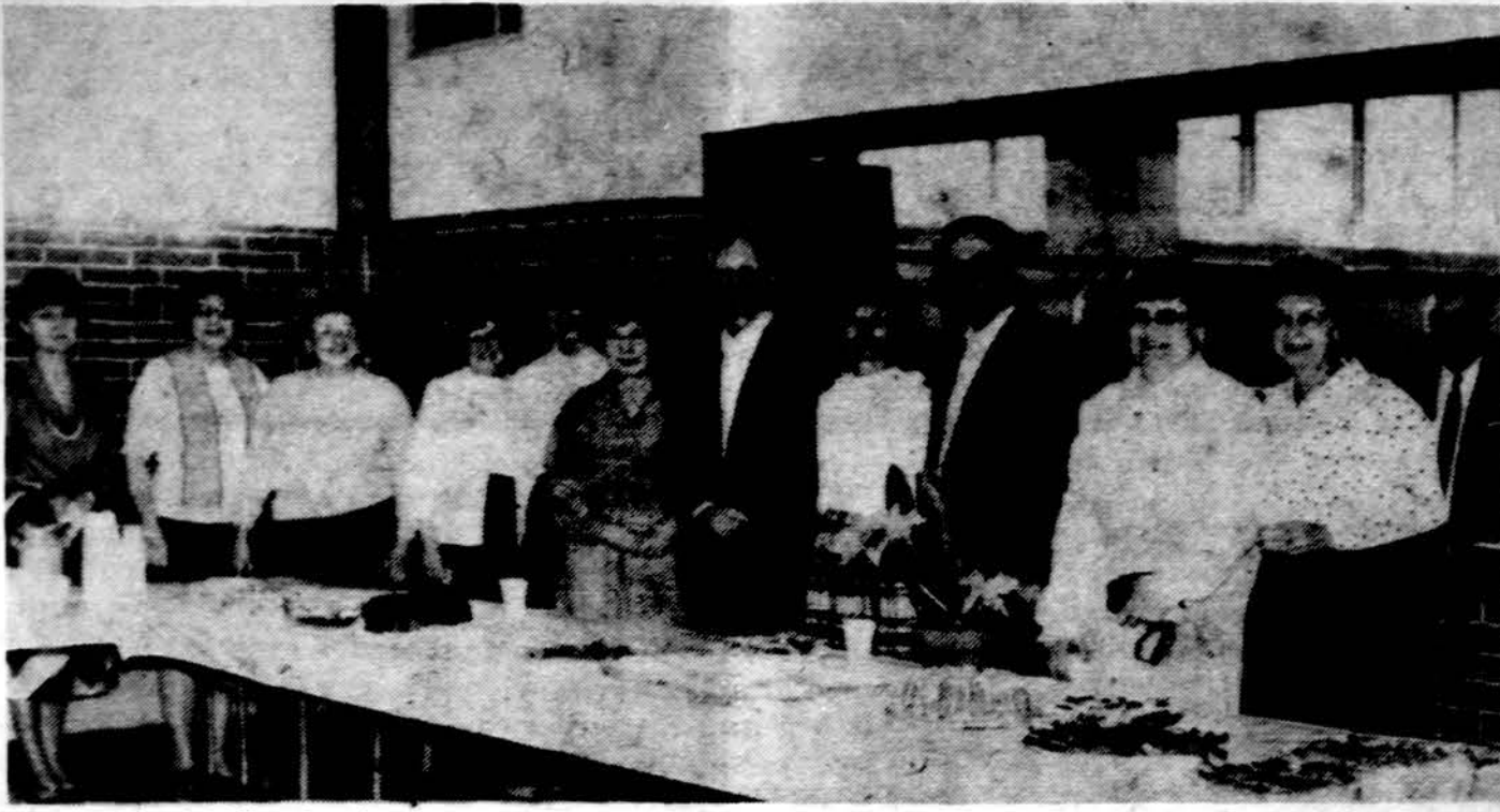
Lietuvos Vyčiai Clevelande.

Stipendijas gali gauti lietuvių kilmės studentai. Stipendijas skiria Students Financial Aids Office, Wayne State University, 222 Administrative Service Building, Detroit, MI 48202. Ten gaunamos aplikacijos. Prie aplikacijos reikia