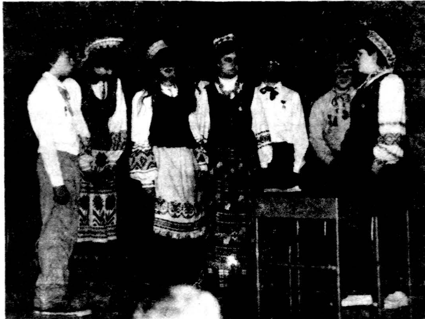
Paskutinę repeticiją prieš pasirodymą scenoje atlieka buvę Dariaus Girėno mokyklos mokiniai dabar jau ČALM aukšt. mokyklos studentai.

x Ieškau pirkti knygos „Ant Ribos“, autorius R. Spalis. Mokėsiu trigubai. Skambinti: 247-0582.