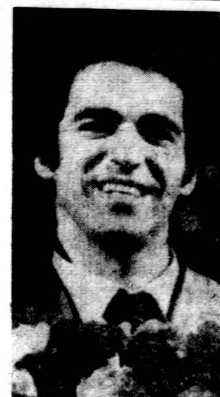
Pasaulio šachmatų čempionas Garis Kasparovas.