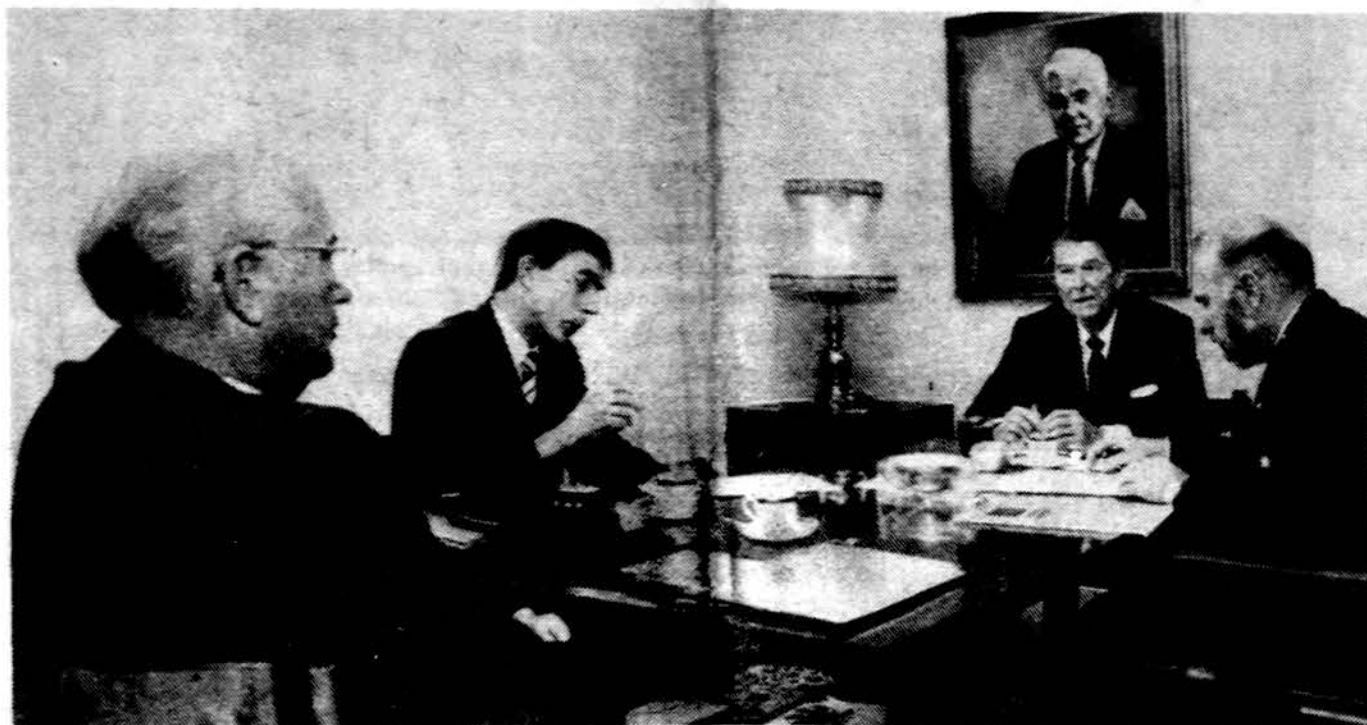
Dar viena detalė iš Islandijoje buvusių pasitarimų, kuriuose prezidentas Ronaldas Reaganas ir generalinis sekretorius Mikhail Gorbaciovus kalbėjosi branduolinių ginklų reikalais. Šalia jų — pastabų užrašytojai, apie ką buvo kalbėta.

Lenkijos vyskupai bendrame ganytojiniame laiške, kuris buvo paskaitytas visoje krašto bažnyčiose, dar kartą neigiamai vertina valdžios informacijos priemonės, kurios neatšizvelgdamos į tai, jog krašto gyventojų daugumą sudaro katalikai, nesiliauja niekinusios krikščionių tikėjimą ir krikščioniškąją moralę. Oficialiosios spaudos uždavinys, rašo vyskupai, yra tarnauti visuomenei ir jos interesams, o ne įtaigoti viešąją opiniją. Katalikus tikinčiuosius Lenkijos vyskupai ragina kritiškai priimti valdiškosios spaudos, radijo ir televizijos skelbiamą informaciją, susilaikyti nuo besaikio televizijos stebėjimo, ypač savo vaikų gerovei. Vyskupai šia proga iškelia nesuprantamus sunkumus su kuriais susiduria katalikų Bažnyčia Lenkijoje informacijos platinimo srityje. Galop, Lenkijos vyskupai kritikuoja ir komunistų partiją, kuri siekia primesti katalikiškąjį krašto gyventojų daugumai dvasines vertybes neigiantį socialistinį gyvenimo būdą ir materialistinę pasaulėžiūrą.