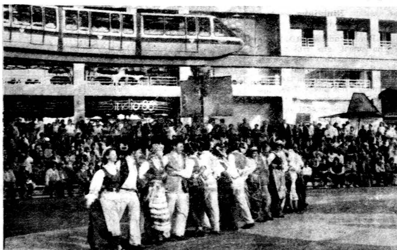
Seattle „Lietutis“, tautinių šokių grupė. Šoka audėjelę EXPO 86 pasaulinėje parodoje Plaza of Nations scenoje Vancouvery.