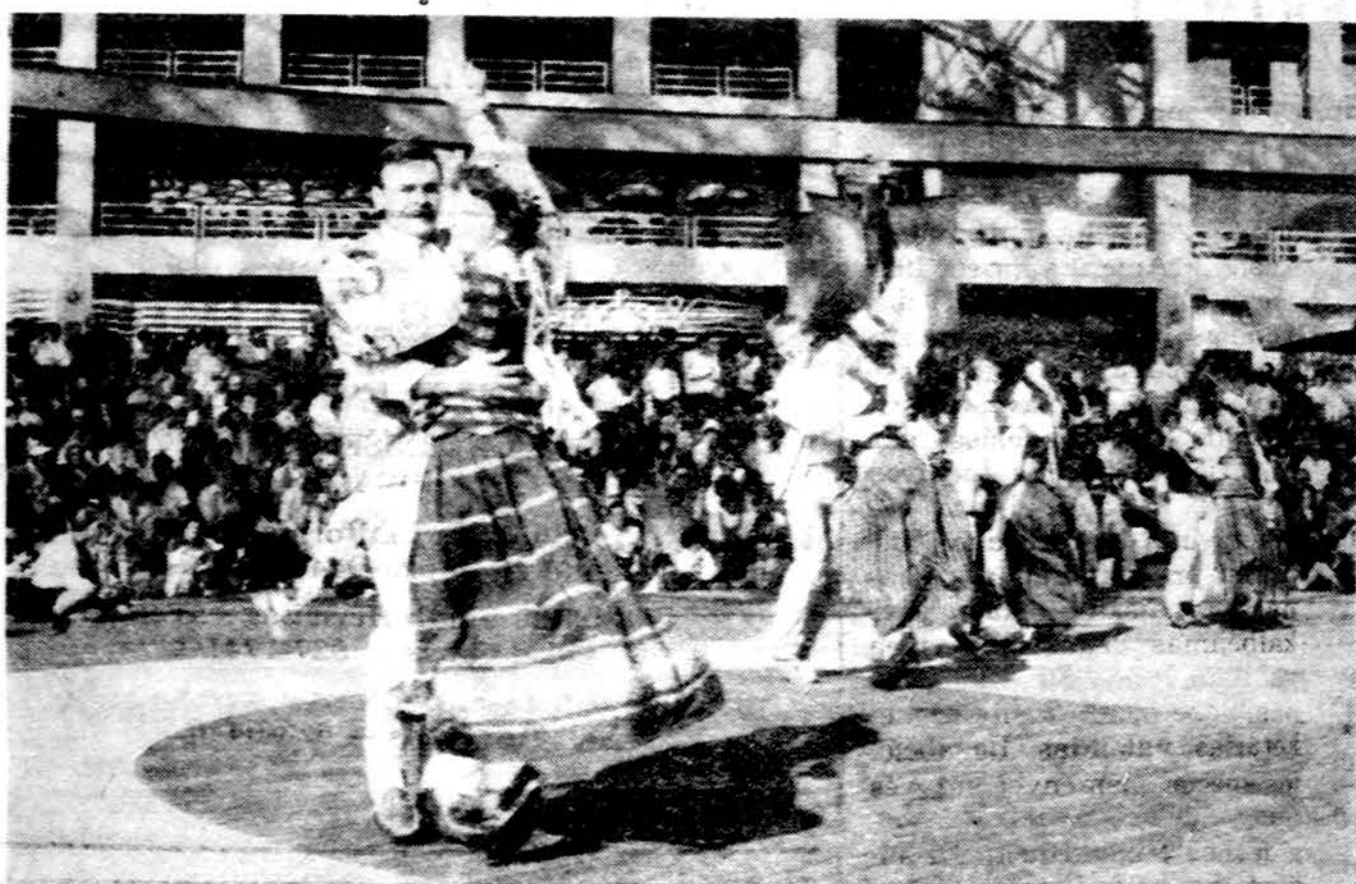
Seattle tautinių šokių ratelis „Lietutis“ šoka subatėlę EXPO 86 pasaulinėje parodoje Vancouveryje. Kanadoje, spalio 5 d.

Pas Minkus gaunamas dienraštis „Draugas“.