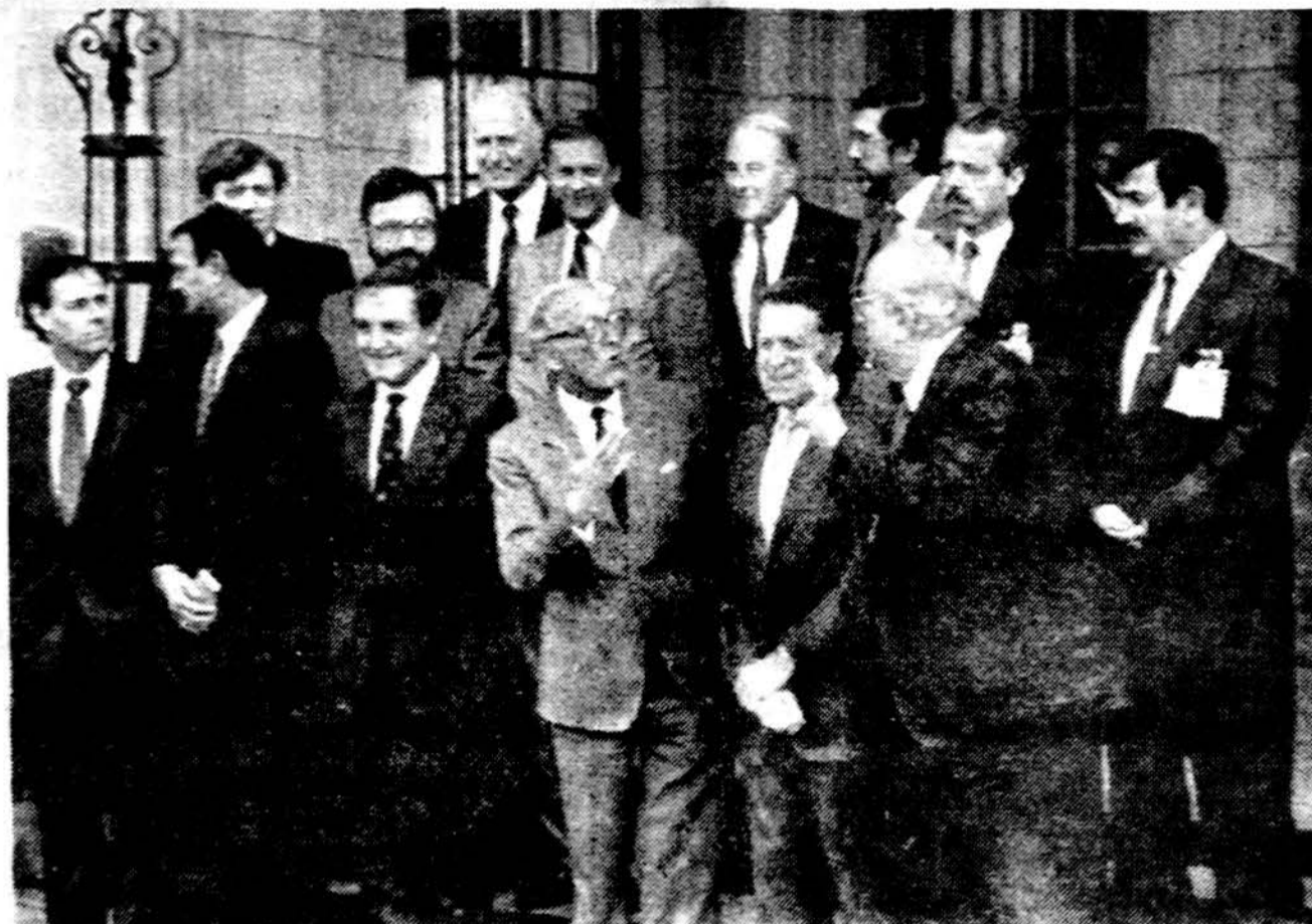
Nato valstybių gynybos ministrai po pasitarimo Gleneagles, Škotijoje. Iš dešinės Giovanni Spadolini iš Italijos, Caspar Weinberger iš JAV; ketvirtas iš eilės George Younger iš Britanijos, Lordas Carrington iš Britanijos yra trečias iš dešinės.

— Chicagoje ir apylinkėse 34,538 žmonės yra užregistruoti dukart balsavimo sąrašuose, praneša Garbingų Rinkimų komitetas. Jie patikrino 200 adresų ir rado, kad naujai užsiregistravusieji savo adresams panaudojo tuščius žemės sklypus, mokyklų adresus ir traukinių bei parkų vietas. Taip pat buvo panaudoti ir kompiuterių duomenys patikrinant Social Security numerius, gimimo datas ir mašinų vairavimo leidimus.