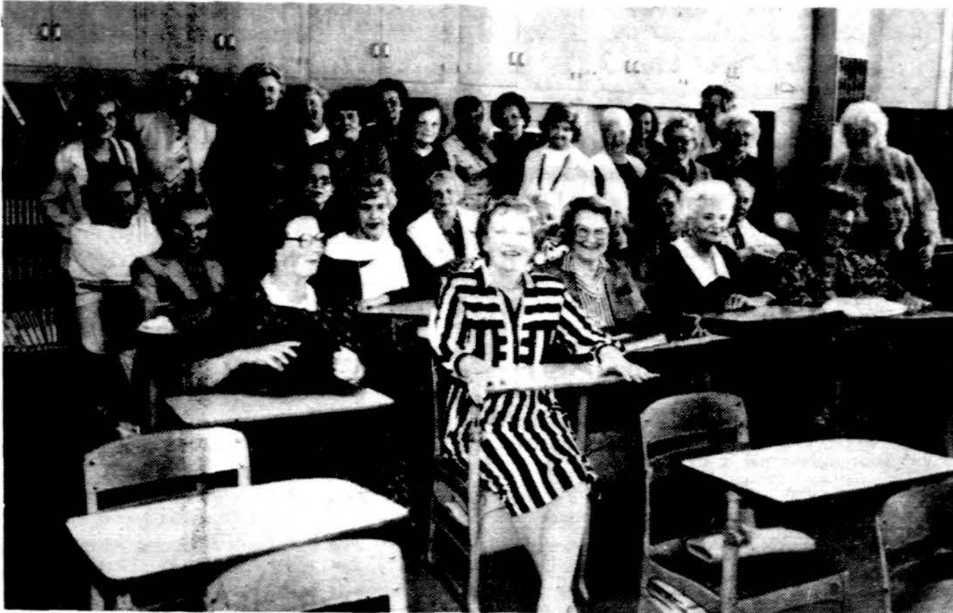
Lietuvos Dukterų draugijos Los Angeles skyriaus susirinkimo dalyvės aptaria veiklos planus.

Tai paskelbus, staiga vidudienį keleviais užsikišo traukiniai, autobusai, o gatvės ir keliai — automobiliais. Toks chaosas kilo, nes kelioms valandoms „bankrutavo“ krašto valdžia. Tačiau pavakare gauta žinia, kad Kongresas pagaliau patvir-