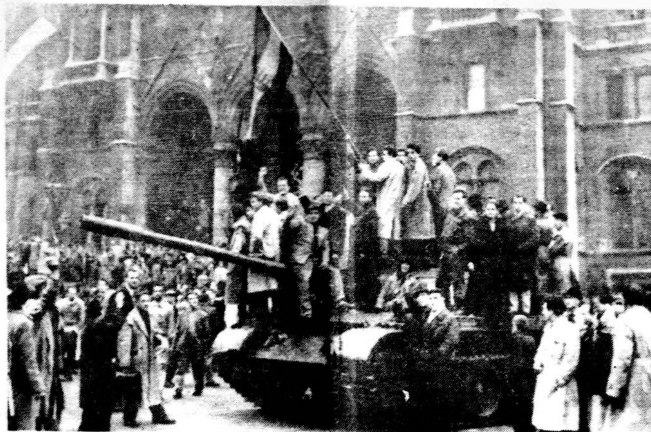
Vengrijos laisvės kovotojai ant pagrobto sovietų tanko Budapešto gatvėse 1956 metų sukilimo metu su Vengrijos vėliava.