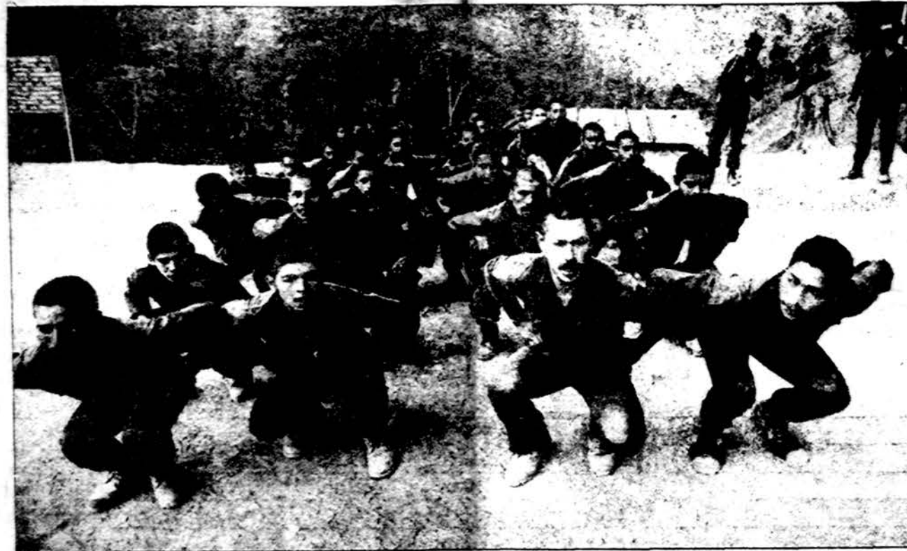
Contras — Nicaragvos laisvės kovotojai apmokymo metu Honduro slaptose stovyklose, netoli Nicaragvos sienos.