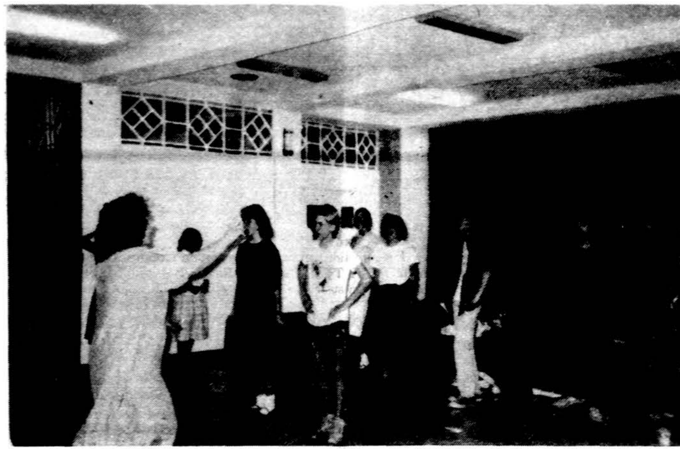
„Grandies“ jaunimo tautinių šokių grupė repetacijos metu Jaunimo centro mažojoje salėje