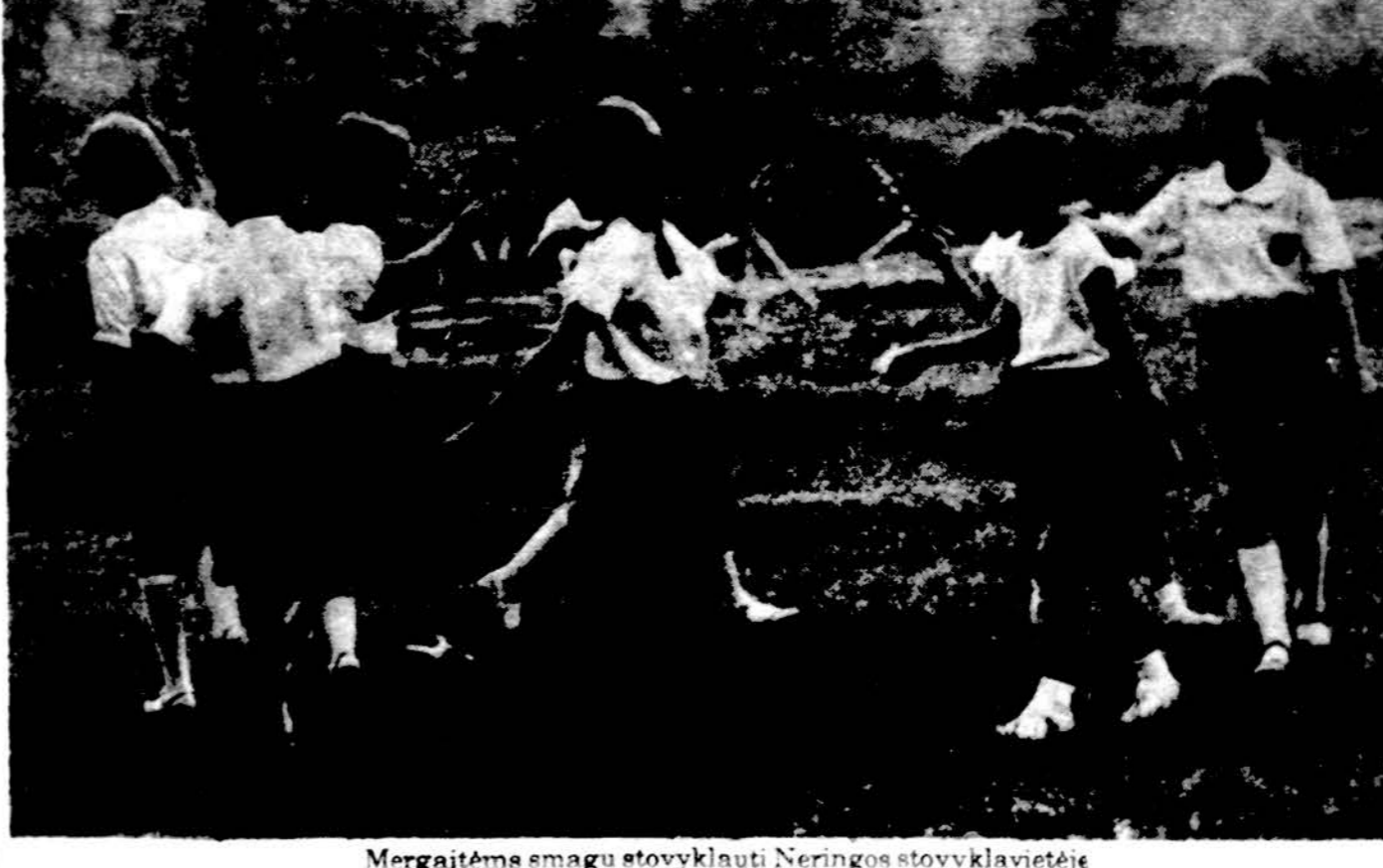
Mergaitėms smagu stovyklauti Neringos stovyklavietėje