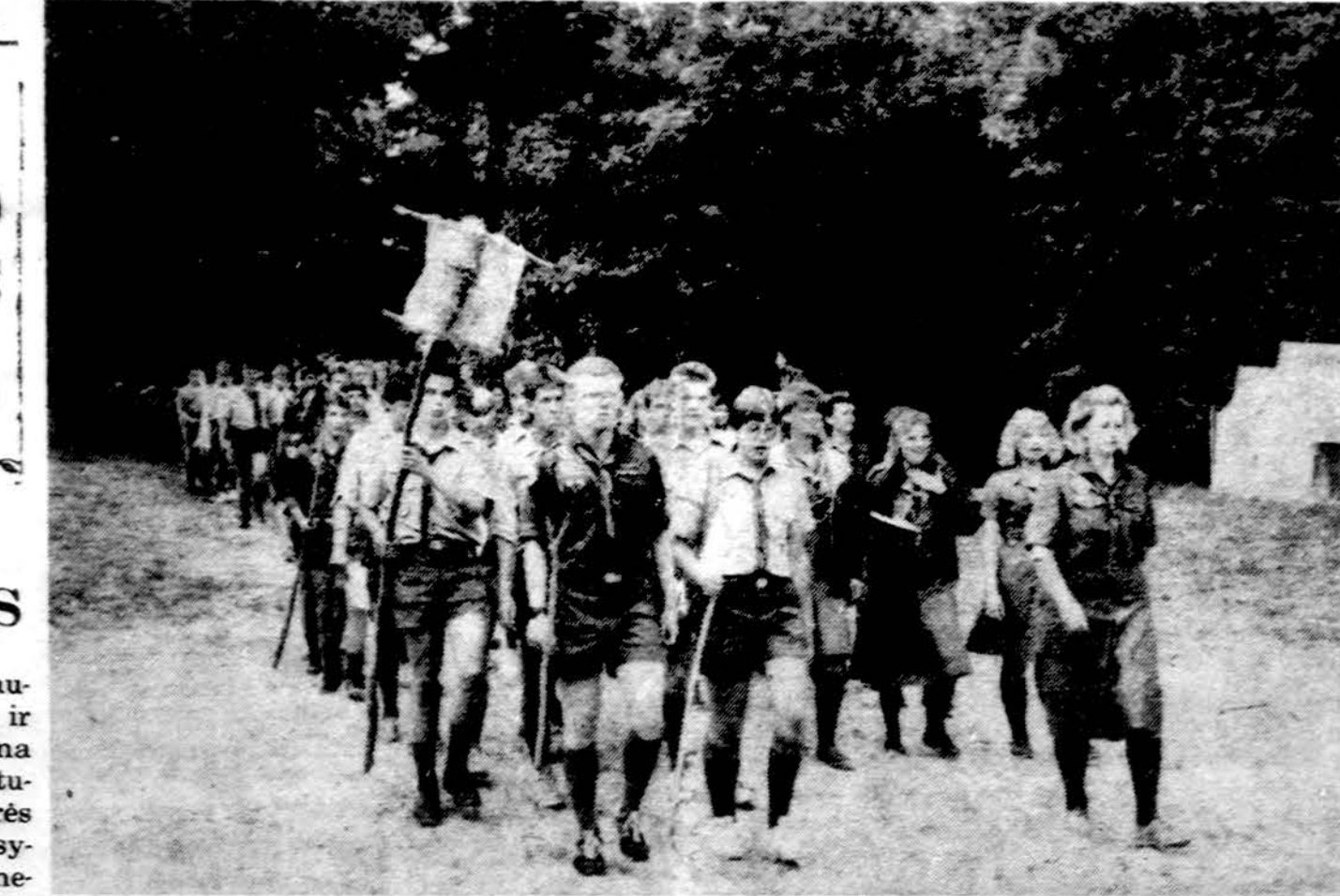
Žygiuoja šių metų JAV Vidurio rajono stovyklos Rake stovyklautojai ir stovyklautojos.

Minėjimas buvo sėkmingas, ir visos rengėjos, kad ir nuvargusios, skirstėsi patenkintos šio renginio kukliai pagerbūsios savo buvusios vadovės sukaktį.