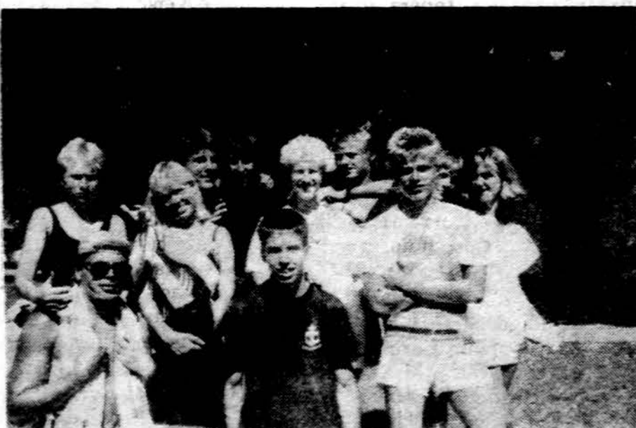
Šių metų būriavimo stovyklos dalis dalyvių.

Chicago tuntų vadovybės pakviesta komisija jau pasiruošė praveisti „Tautoramą“ skautams, skautėms, jūrų jauniams ir jaunėms, vilkiukams, paukštytėms, ūdrytėms, ir bebrams. „Tautorama“ įvyks sekma-dienį, lapkričio 16 d. Visi minėti broliai ir sesės (uniformuoti) renkasi 10 val. ryto Jaunimo centro II-jo aukšto koridoriuje. Būreliai ir skiltys atskirose stotyse atliks tautinio pobūdžio pratimus ir užsiėmimus pagilinti savo žinias apie Lietuvą ir jos kultūrą. Visi vadovai ir vadovės prašomi pasirūpinti, kad jų vietos būtų pilnai dalyvauti užsiėmimuose. Prašoma kontaktuoti tėvus ir gauti jų užtikrinimą, kad skautukai, kės bus laiku atvežti į Jaunimo centrą. Įtikinkite tėvus šio renginio reikalingumu jų vaikams.