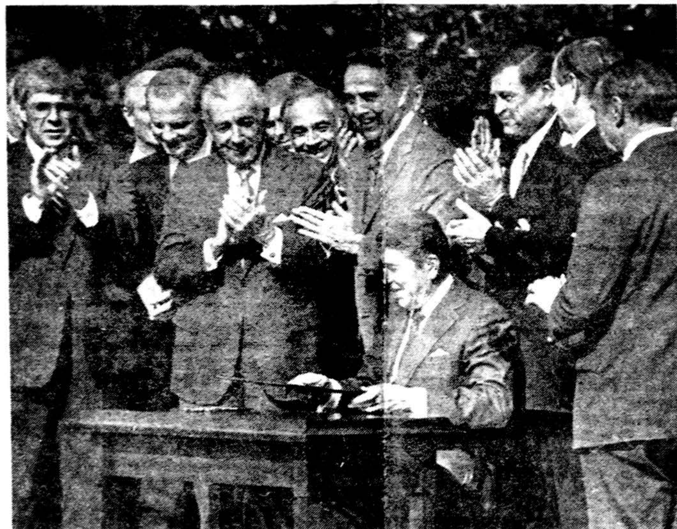
Prezidentas Ronald Reagan pasirašo naują istorinį mokesčių įstatymą, kuris palies kiekvieną JAV gyventoją. Iš kairės kongr. Jack F. Kemp, Izdo sekretorius James A. Baker III, Baltųjų rūmų štabo direktorius Donald Regan, kongr. Bill Gradison, Senato daugumos vadas Bob Dole, kongr. Dan Rostenkowski, kongr. John J. Duncan ir sen Strom Thurmond.