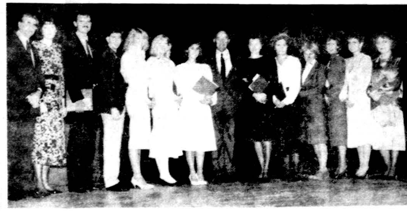
Lietuvių Fondo stipendininkai, dalyvavę pokylyje ir gavę stipendijos čekius.

Darbo val. nuo 9 iki 7 val. vak. Šeštad. 9 v. r. iki 1 val. d.