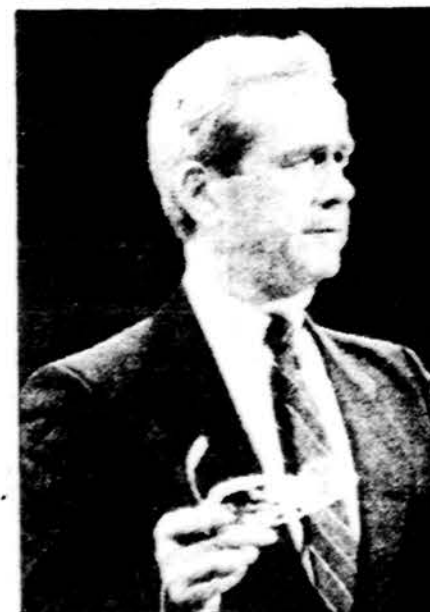
Robert McFarlane, kuris užmezgė ryšius su Iranu.

Nors Baltieji rūmai sako, kad nėra prasilenka su istatymais, tačiau ekspertai nori sužinoti daugiau detalių, kad galėtų galutinai pasakyti, jog Amerika neprasižengė savo istatymams. Šios operacijos ejo per kelias valstybes. Amerikoje yra istatymas, išleistas dar 1868 m., pagal kurį Amerikos prezidentas, ginąs savo pilietį, turi pranešti apie savo daromus žygius jam padėti Amerikos Kongresui tada, kada jam atrodo, kad yra praktiška.