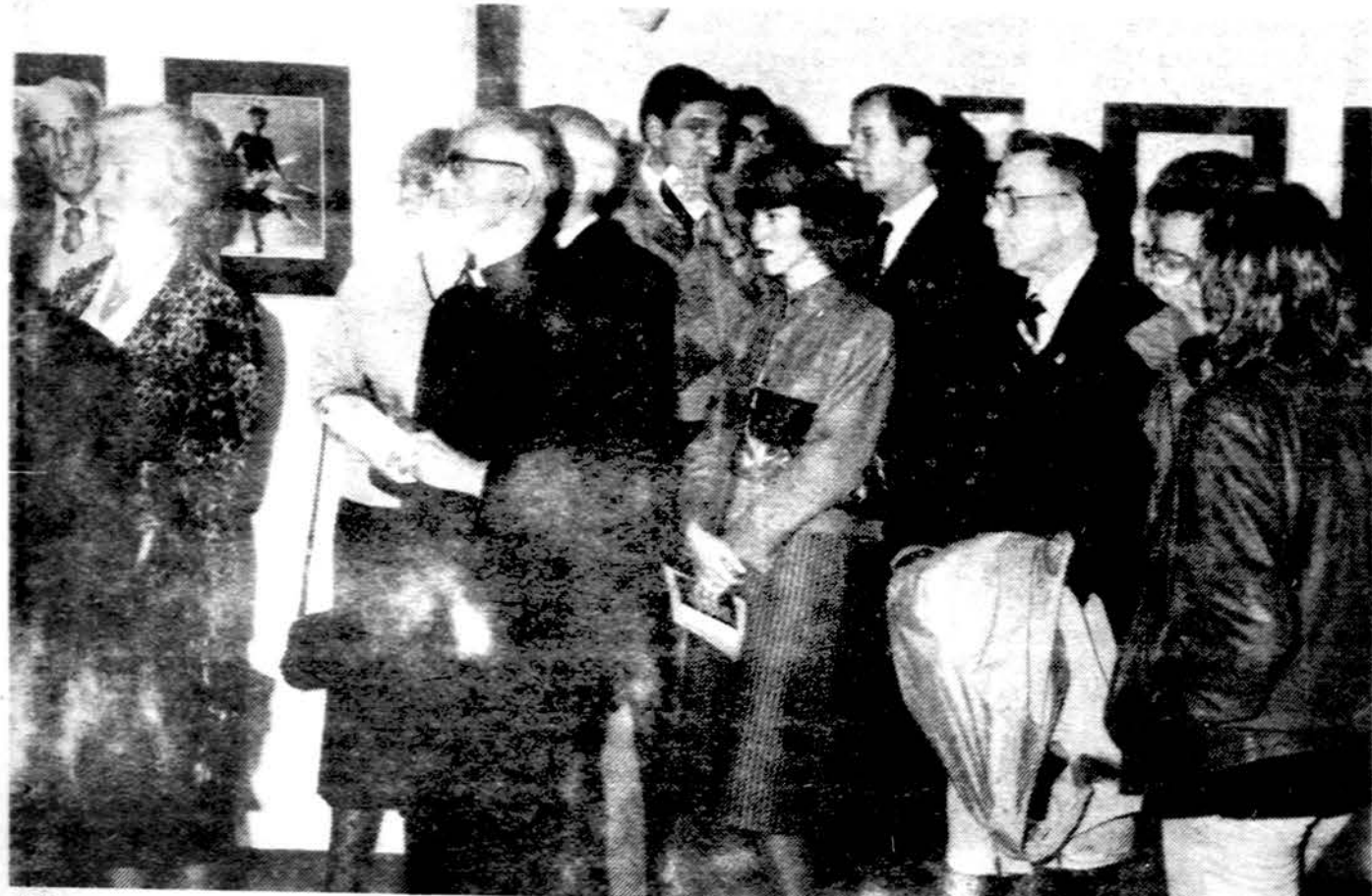
Filatelijos parodos atidaryme Jaunimo centre