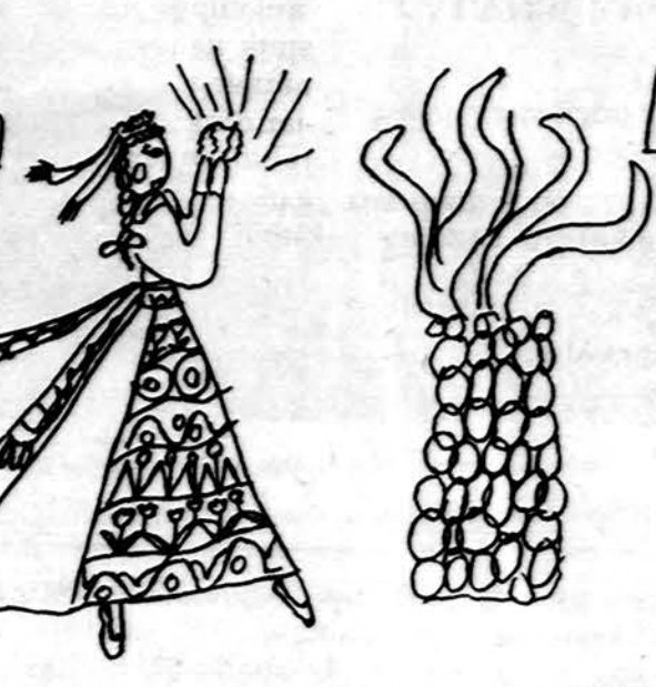
Lemonto Maironio lit. m-los 2 sk. mokinė. Piešė Lina Sidrytė,

Isteigtas Lietuvių Mokytojų Sąjungos Chicago skyriaus