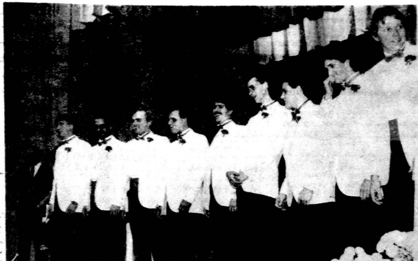
Clevelando dainos vienetas „Uzdainuokim“, atlikęs programą Hartforde, Conn., spalio 25 d.