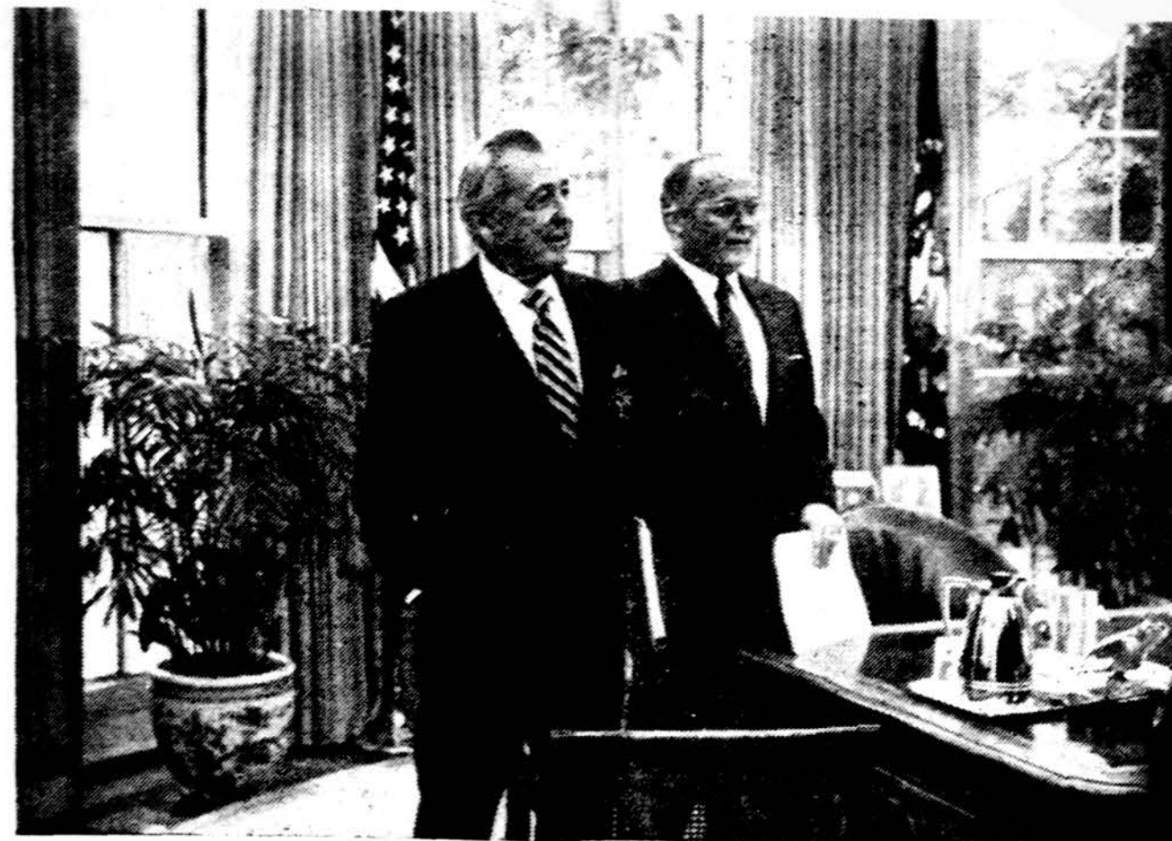
Du pagrindiniai Baltųjų rėmų pareigūnai — Donald T. Regan, štabo viršininkas, kairėje, ir admiralas John M. Poindexter, tautinio saugumo patarėjas, kurie apsprendė ginklų siuntimo reikalus į Iraną.