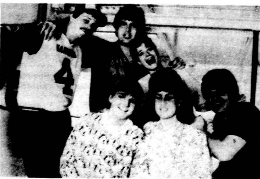
Toronte vykusioje Nepaprastoje konferencijoje jaunimas rado laiko ir maloniam pabėdavimui.