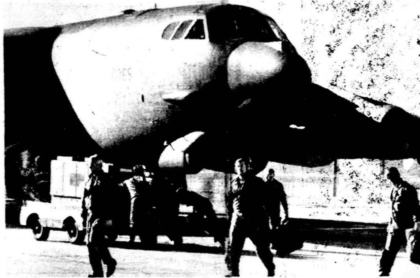
Bombonešio B-52 tarnybos vyrai atskraidino šį laivyno raketų bombonešį į Carswell oro pajėgų bazę Texas valstijoje aktyviai tarnybai.

valstybių okupaciją: meška su raudona žvaigžde ant kaktos tempė moterį, aprengtą kalinės drabužiais ir surakintą grandinėmis. Kalinę vaizduojanti moteris buvo iškelusi lentelę su užrašu: Maskva po kojomis trypia žmogaus teises — sulaikykite sovietus arba atšaukite Helsinkio susitarimus. Sovietai protestuoja „Frankfurter Allgemeine Zeitung“ praneša, kad i Pabaltiečių ir tarptautinių žmogaus teisių organizacijų surengtas demonstracijos griežtai reagavo sovietų ambasadorius, pateikdamas Austrijos vyriausybei protesto notą. Tačiau Austrijos vyriausybė atsakė sovietų diplomatai, kad Austrijoje galioja demonstracijų ir susirinkimų laisvė, kuria visi gali pasinaudoti. Europos saugumo ir bendradarbiavimo konferencijos proga Tarptautinė Helsinkio Federacija pateikė konferencijos dalyviams ir pasauliui pranešimus apie žmogaus teisių pažeidimus Europos kraštuose. Pats