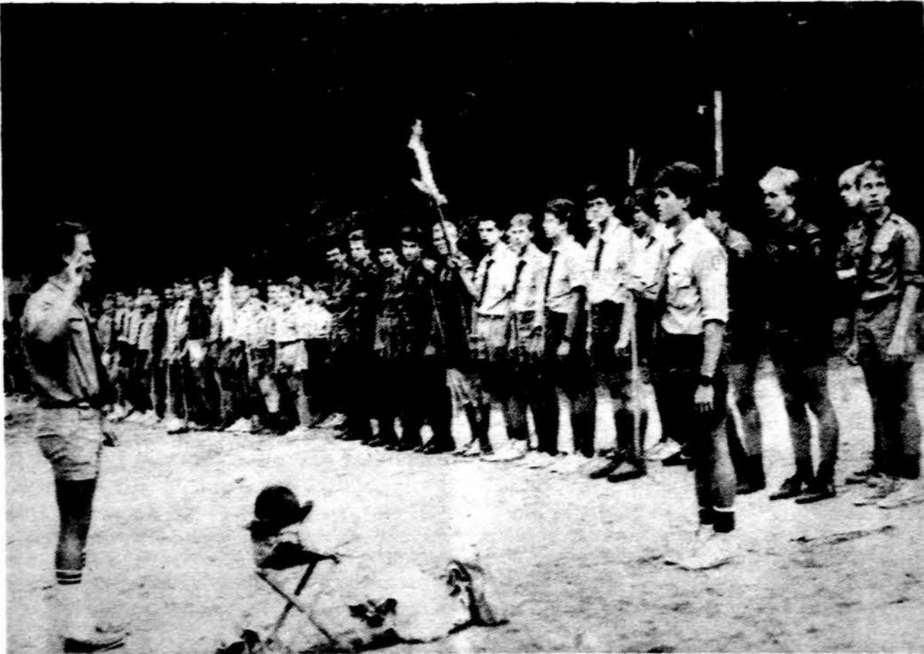
Brolių gretos JAV Vidurio rajono stovykloje Rake.

Akademiški skaučių draugovė (ASD) Chicagoje kviečia visas mergaites, pradėjusias studijas universitetuose, įsijungti į skaučių akademiškių veiklą. Visos kviečiamos dalyvauti šeštadienį, gruodžio 6 d., 3 val. p.p. Balzeko Lietuvių Kultūros muziejuje ruošiamoje arbatėlėje.