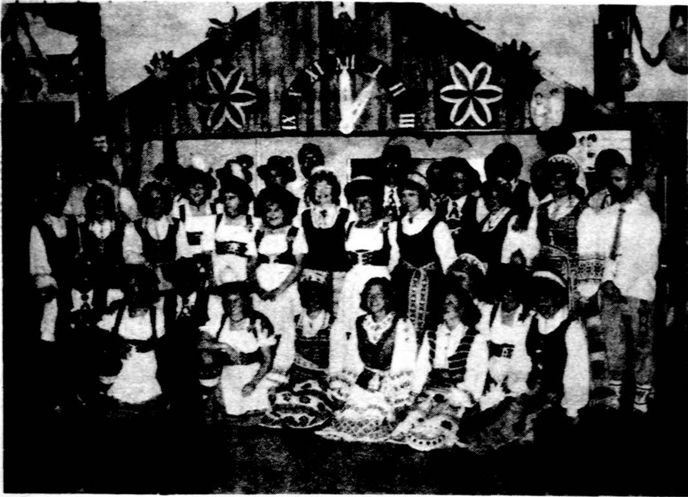
„Vetra“ — lietuvių šokėjų grupė New Havene, Conn.