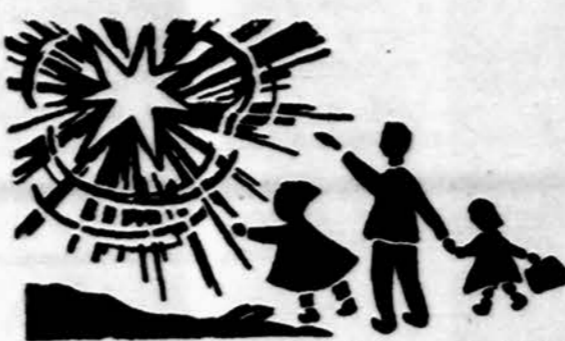
Redaguoja J. Placas. Medžiagą siųsti: 3206 W. 65th Place, Chicago, IL 60629

x Ieškoma lietuviškai kalbanti moteris prižiūrėti 3 mėn. berniuką Orland Parko — Lemonto apylinkėje. Skambinti 460-8416.