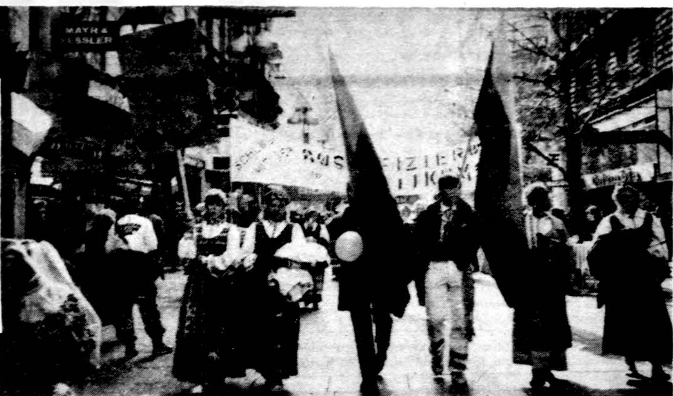
Demonstracijos Vienoje, Austrijos sostinėje, lapkričio 4 d.