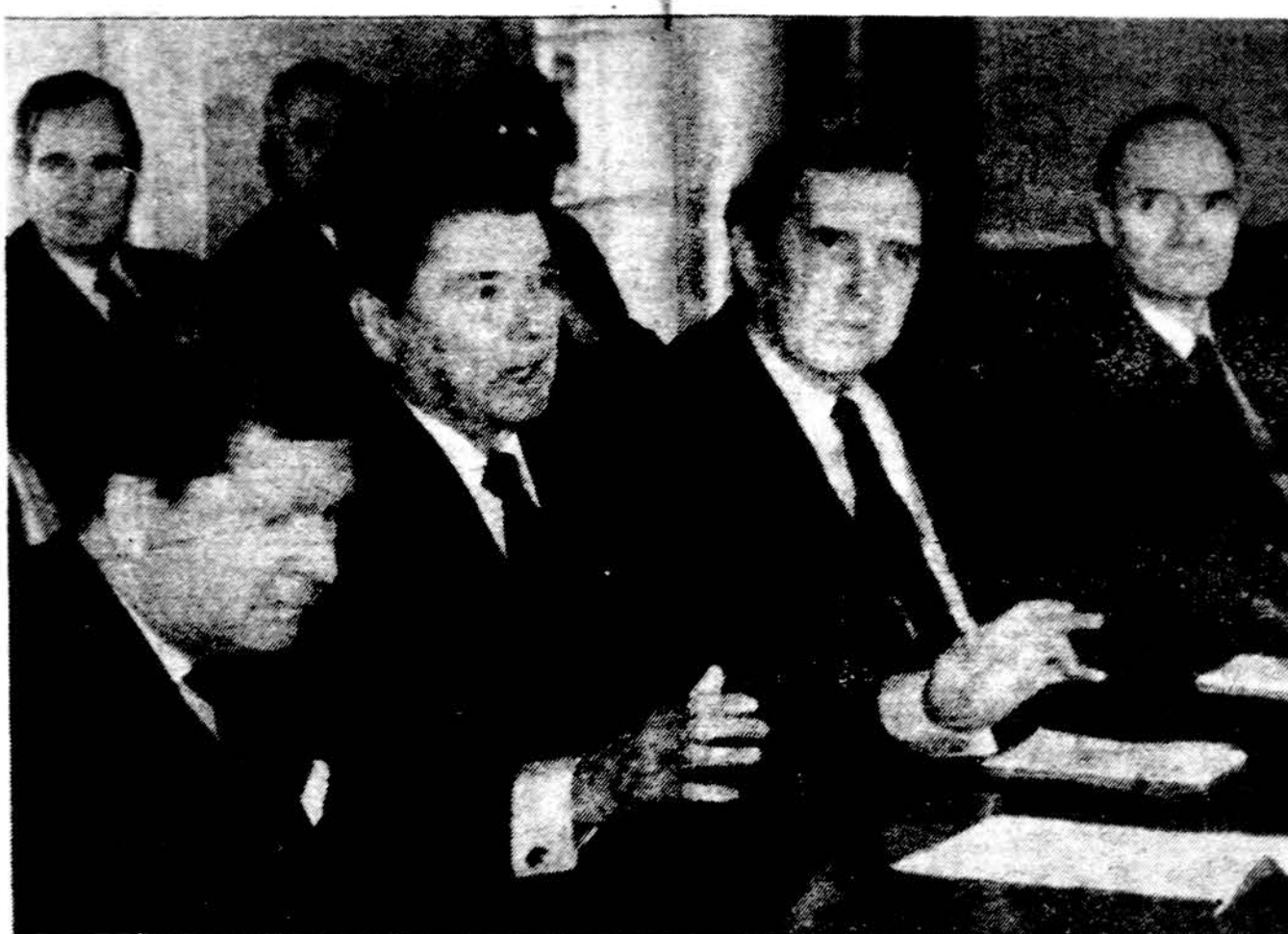
Prezidentas posėdžiauja su komisija, kuri tiria Tautinės Saugumo tarnybos darbus Irano ginklų pardavimo reikaluose. Iš kairės buvęs senatorius John Tower, o kitoje prezidento puseje buvęs senatorius Edmund Muskie ir admirolas Brend Skowcroft.

KGB agentai nesako, kodėl jie turi išvažiuoti. Atrodo, kad