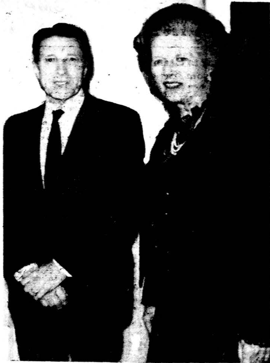
Amerikos Gynybos departamento sekr. Casper W. Weinberger su Britanijos ministere pirmininke Margaret Thatcher jos įstaigoje. Jie, kaip pranešama, diskutavo Vidurinių Rytų situaciją po ginklų pardavimo Iranui.