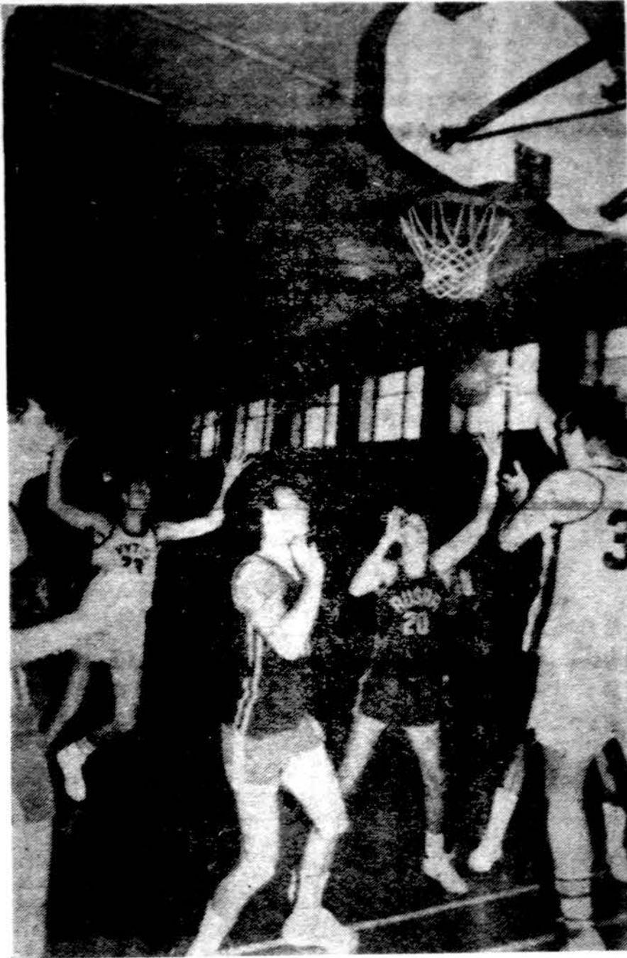
Toronto „Vytis“ ir „Aušra“ rungtyniauja Montrealyje vykusiame XXXI-se Lietuvos dienose.