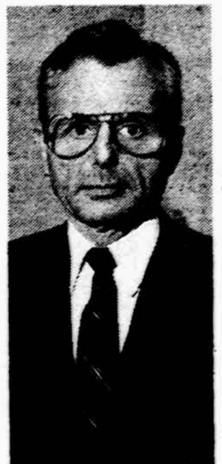
Naujasis Tautinės Saugumo tarybos direktorius Frank C. Carlucci.

Jis buvo konsulu Tanzanijoje ir politiniu patarėju Rio de Janeiro. D. Rumsfeld pasikvietė jį savo padėjėju Nixonu administracijoje ir vėliau perėmė jo pareigas. Tada jis stipriai susikirtė su R. Reaganu, kai šis buvo Californijos gubernatoriumi. Reaganas tada norėjo panaikinti tuo metu veikusią kaimo aprūpinimo programą, kuri buvo finansuojama per jo vadovaujamą agentūrą. Carlucci tada sugebėjo išlaviruoti tarp Reagano ir Baltųjų rūmų ir programa liko ir toliau nepanaikinta. Jis priešinosi Baltųjų rūmų nusistatymui, kai buvo ambasadoriumi Portugalijoje. Jis tada buvo už ryšių palaikymą su kairiųjų militarine valdžia, nežiūrint, kad Kissingeris buvo prieš ir sakė, kad Portugalijos negalima remti, nes ji bus komunistinė valstybė. 1977 m. Carteris jį paskyrė CIA direktoriaus pavaduotoju, o vėliau Weinbergeris pasikvietė į Pentagoną. Konservatoriai dažnai buvo prieš jo nusistatymus, bet pakeitė nuomonę, kai jo buvimo metu Pentagono Reagano administracija pasiekė daug daugiau apsiginklavimo srityje, ko dar nėra buvę Amerikos istorijoje. Carlucci čia turėjo pagrindinę rolę, nes Weinbergeris buvo užimtas dar svarbesniais dalykais. Iš Pentagono jis perėjo į privačią industriją. Dabar ir vėl pačiame zenite.