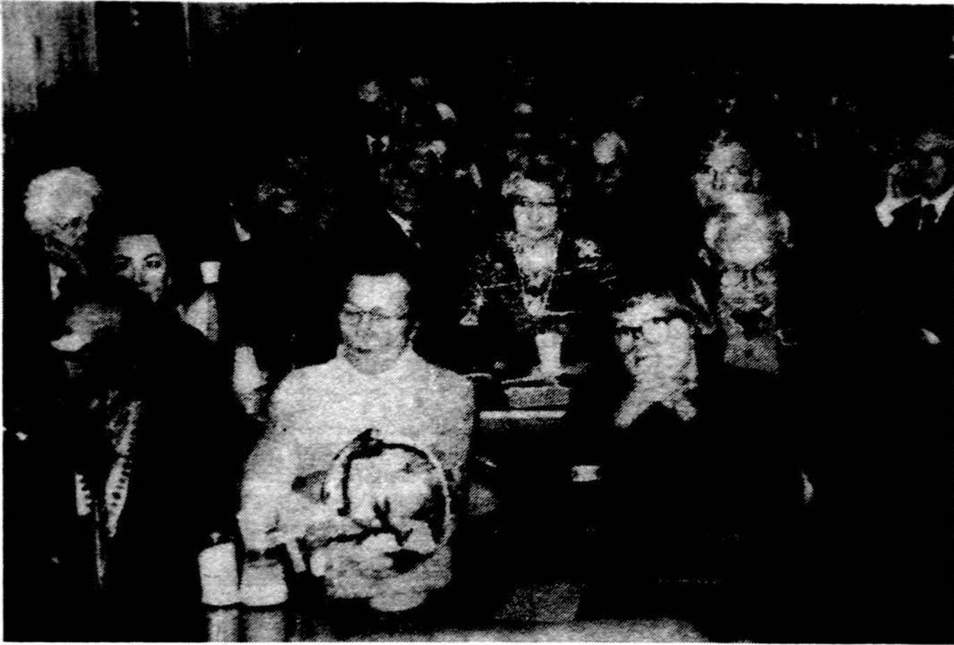
Kariuomenės šventės minėjimo Detroito dalis dalyvių.