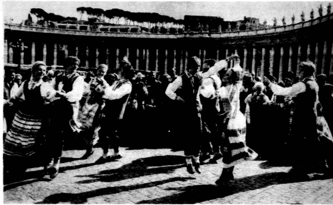
„Grandinėle“ Vatikane, Šv. Petro Bazilikos aikštėje 1984 m. kovo 5 d.