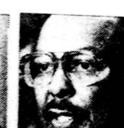
Louis Stokes, D-Ohio