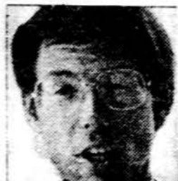
Bill McCollum, R-Florida