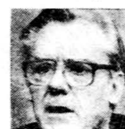
William Broomfield, R-Michigan