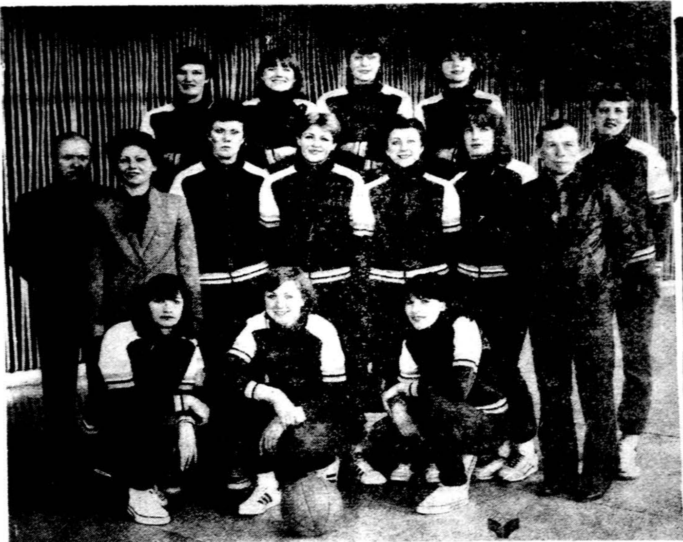
„Kibirkštis“ — Vilniaus moterų krepšinio vienetas, kuris pasižymi savo žaidynėmis šalia „Zalgirio“ vyrų krepšinio komandos