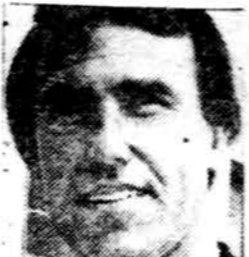
Jim Courter, R-New Jersey