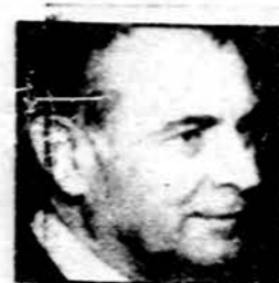
Lee Hamilton, pirmininkas, D-Indiana

Atstovų Rūmai sudarė 15 kongresnėnų komitetą, kuris tirs Baltųjų Rūmų pareigūnų veiklą Irano reikaluose.