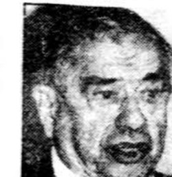
Dante Fascell, D-Florida