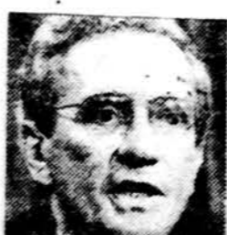
Ed Jenkins, D-Georgia