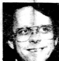
Michael DeWine, R-Ohio