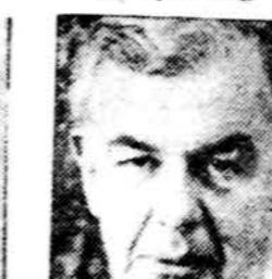
Thomas Foley, D-Washington