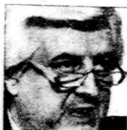
Henry Hyde, R-Illinois