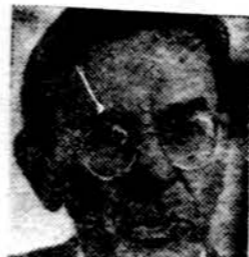
Edward Boland, D-Massachusetts