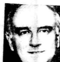
Les Aspin, D-Wisconsin