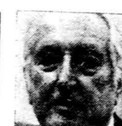
Peter Rodino, D-New Jersey