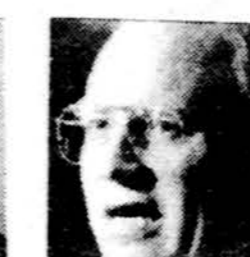
Dick Cheney, R-Wyoming