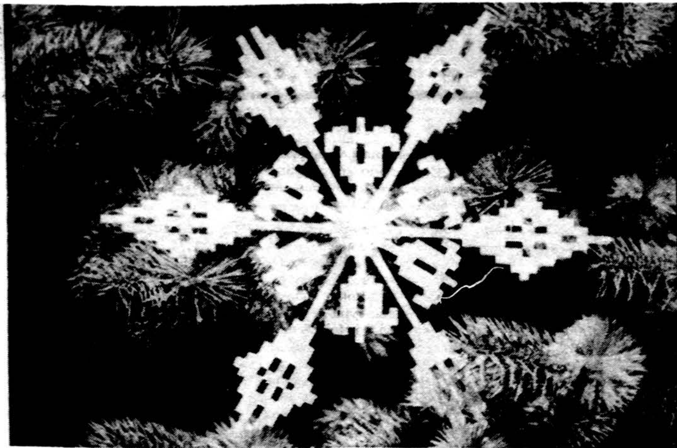
Linksmų Kalėdų! Detalė iš Vydūno Jaunimo Fondo išleistos sveikinimų kortelės, panaudojant Ž. Valentainaitės nuotrauką.

„Aušros Vartų“ skautių tuntas „Kernavės“ skautių tuntas „Nerijos“ jūrų skautių tuntas „Lituanicos“ skautių tuntas Chicagos skautininkų, -ių Ramovė Chicagos skautininkų draugovė