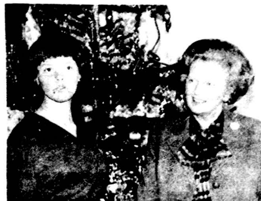
Disidentė, kovotoja už žmonių teises, sovietų poetė Irina Ratušinskaja, 32 m. amžiaus, kuri išbuvo darbo stovykloje 4 metus iš septynerių, pas Britanijos premjerę Margaret Thatcher, kairėje, kai ji kartu su savo vyrų atvyko į Londoną sveikatos reikalais. Jie jau pareiškė norą apsigyventi Vakaruose.

Laikraštis betgi rašo, kad partija, Gorbačiovo vedama, pradėjo socialinio ir ekonominio gyvenimo gerinimą ir revoliucionieriškai atstatyti tai, kas yra labai reikalinga kraštui.