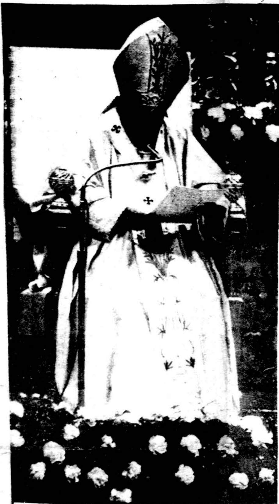
Popiežius Jonas Paulius II skaito savo pamokslą šv. Mišių metu Kaledų naktį šv. Petro bazilikoje.

Dalyvaujant Ispanijos karaliui spalio 20 dieną Deusto katalikų universitetas Bilbao mieste iškilmingai paminėjo savo įsikūrimo šimtmetį. Tėvų jėzuitų vadovaujamame Deusto ispanų katalikų universitete dabar mokosi apie 14 tūkstančių studentų. Profesorių — dėstytojų, kunigų ir pasauliečių yra apie penki šimtai. Universitetas turi aštuonis fakultetus. Jo žinioje veikia šešiolika įvairių mokslo sričių institutų ir aukštųjų mokyklų. Deusto universitetas Ispanijoje yra ne tik svarbi aukštojo mokslo institucija, bet taip pat vienas žymiųjų krikščioniškosios kultūros centrų, ugdančių dialogą tarp tikėjimo, mokslo ir kultūros.