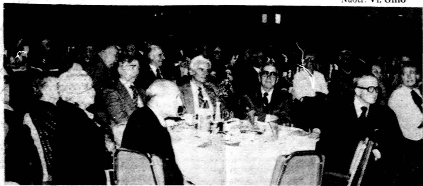
Los Angeles lietuviai klausosi poeto Kazio Bradūno Šv. Kazimiero parapijos salėje gruodžio 6 d. vykusiame XXI-me literatūros vakare.