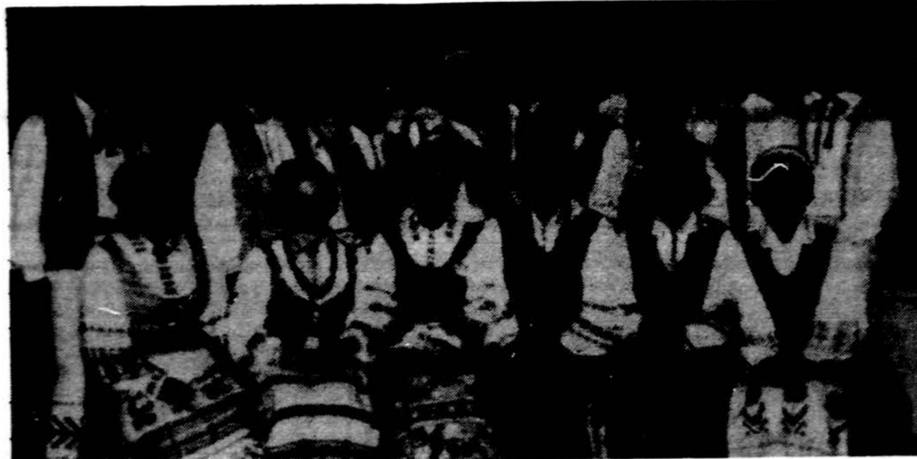
Floridos choras po programos