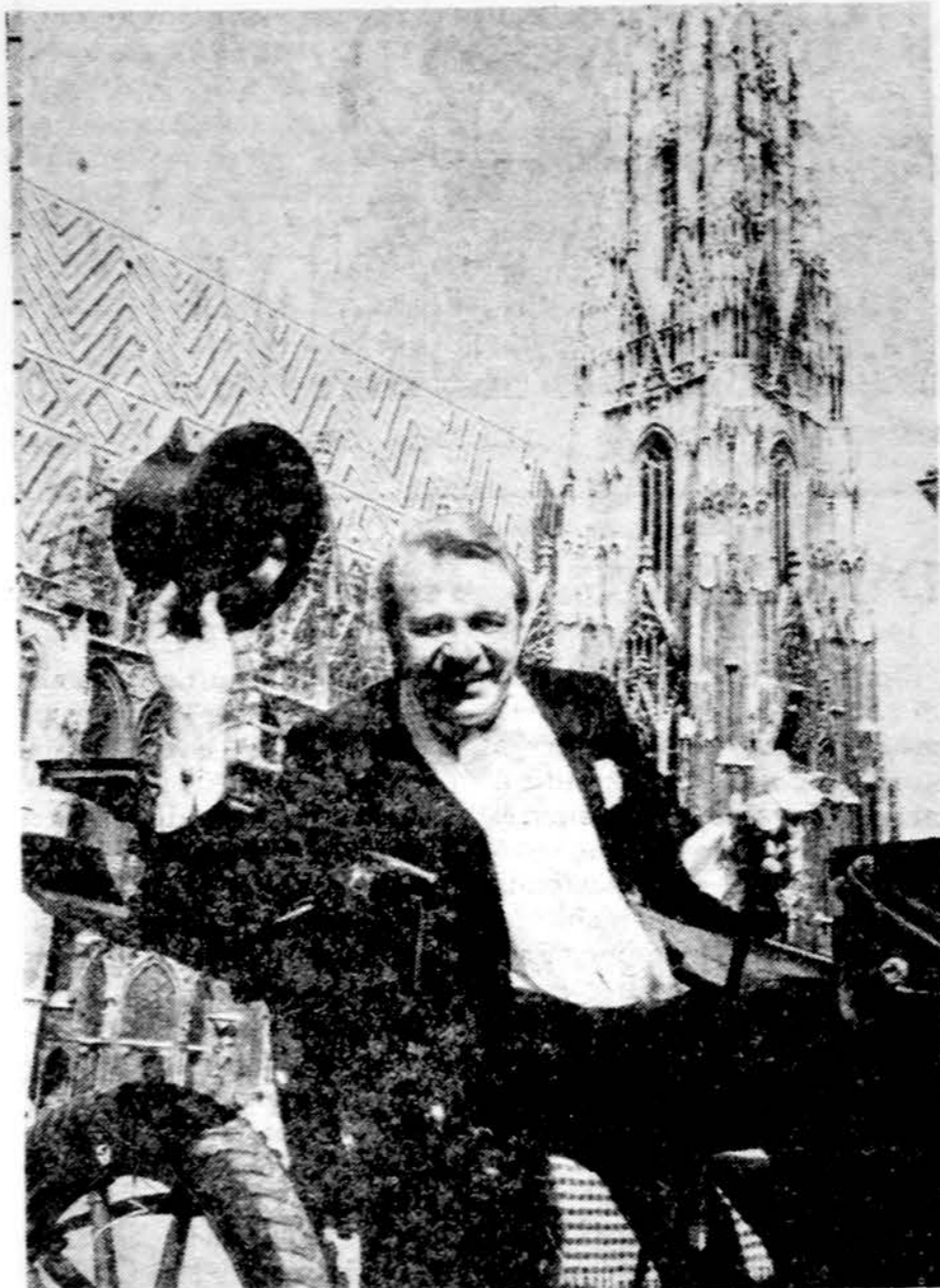
Harald Serafin, Vienos „Volkoper“ solistas, karieta pravažiuoja pro Sv. Stepono katedrą Vienoje.