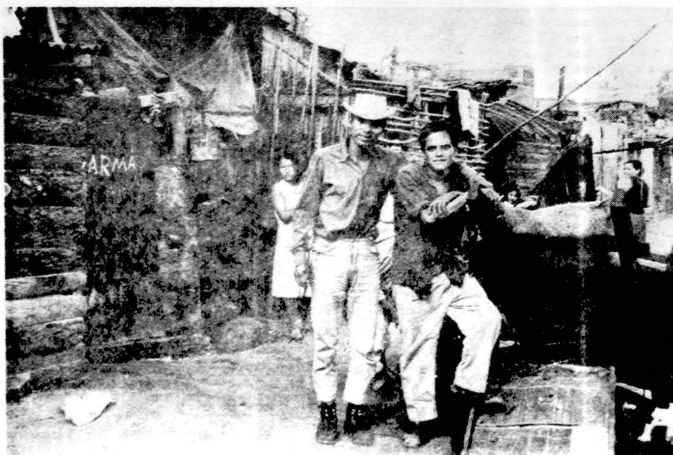
Gyventojai Nardo gatvėje, Meksiko City