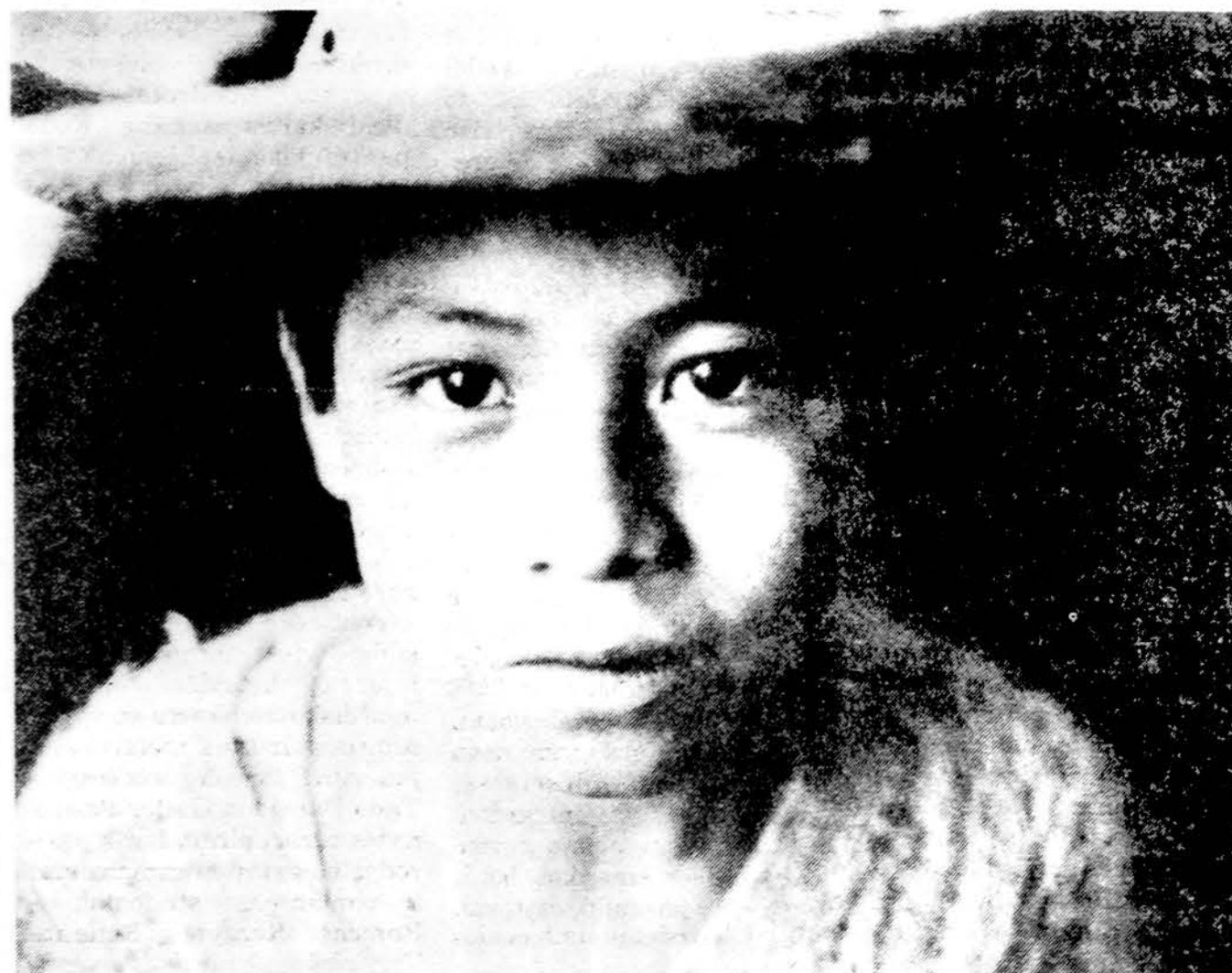
Berniukas Xochimilco miestelyje, Meksikoje.