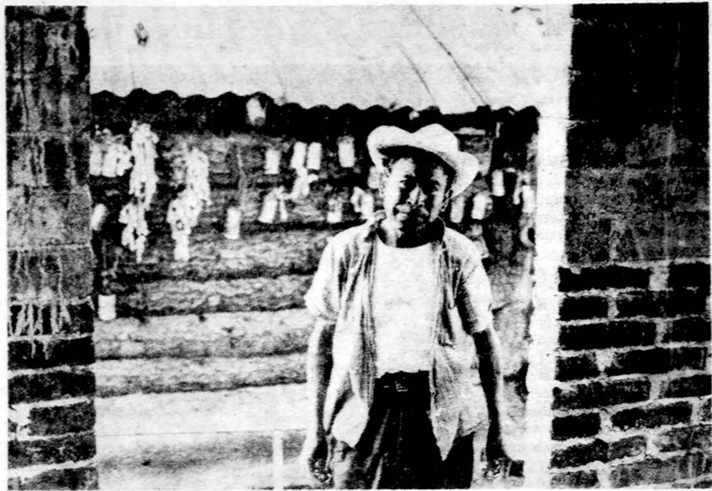
Gyventojas Xochimilco miestelyje, Meksikoje.

Naujaisiais laikais, vos pradėjus formuotis pramonės erai, krikščioniškoji mintis apie darbą turėjo prieštarauti įvairioms materialistinėms ir ekonomistinėms srovėms. Kai kurie tokių idėjų šalininkai suprato ir laikė darbą tam tikros rūšies preke, kurią darbenys – pirmiausia pramonės darbininkas – „parduoda“ darbdaviui; tasai yra kapitalo, arba visą darbą igalimančių įrankių ir priemonių, savininkas... Imonų savininkai, vykdydami didžiausio pelno, stengėsi nustatyti darbininkams kuo mažesnę užmokesį. Dar reikia priminti kitus išnaudojimo elementus: darbo saugumo stoka, nesirūpinimą sudaryti darbininkui ir jo šeimai reikalingas sveikatos ir kitas gyvenimo sąlygas... Reakcija (suprask: socializmo, komunizmo, fašizmo, nacizmo) prieš (šią) neteisingsą sistemą, dangaus keršto šaukiančią skriaudą, anot Šv. Rašto, kuri slėgė žmogų anos skubios industrializacijos metų, buvo socialinės moralės patiesinama. (Juk) tokia padėtis skatino socialinę politinę liberalizmo sistemą. Ji, pagal savo ekonomistinius principus, saugojo ir rėmė tik kapitalo savininkų ir imonininkų ūkinę iniciatyvą, nepakankamai rūpindamasi darbo žmogaus teisėmis ir tvirtindama, kad žmogaus darbas tesas gamybos priemonė, o kapitalas – produkcijos pagrindas, mastas ir tikslas... Taip (ekonominis) konfliktas tarp darbo ir kapitalo perėjo į sistemingą klasių kovą... siekiančią įvesti proletariato diktatūrą... socialinę revoliu-