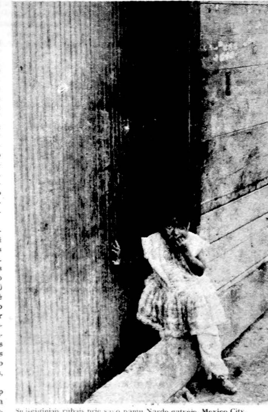
Su sieginiiais rūbais prie savo namų Nardo gatvėje, Mexico City.