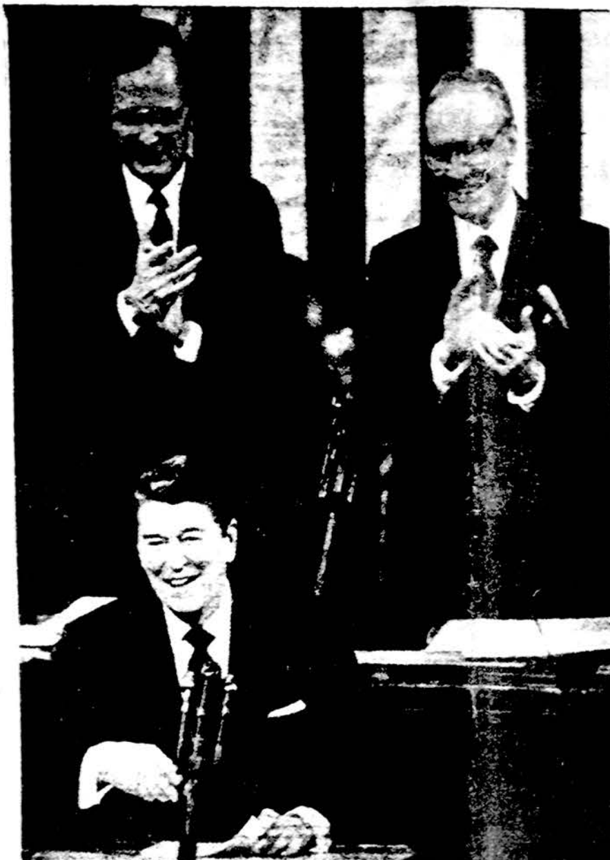
Viceprezidentas George Bush, kairėje, ir Atstovų rūmų speakeris Jim Wright pasitinka kartu su visais 100-jo Kongreso nariais, Vyriausiojo Teismo nariais, kabineto nariais ir diplomatinio korpusu JAV prezidentą Ronald Reagan prieš jam pradėdant metinę valstybinę kalbą Amerikai sausio 27 d., 8 val. vak.