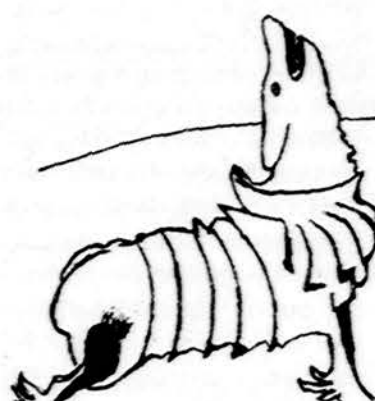
Geležinis vilkas vėl Panery sustaugs