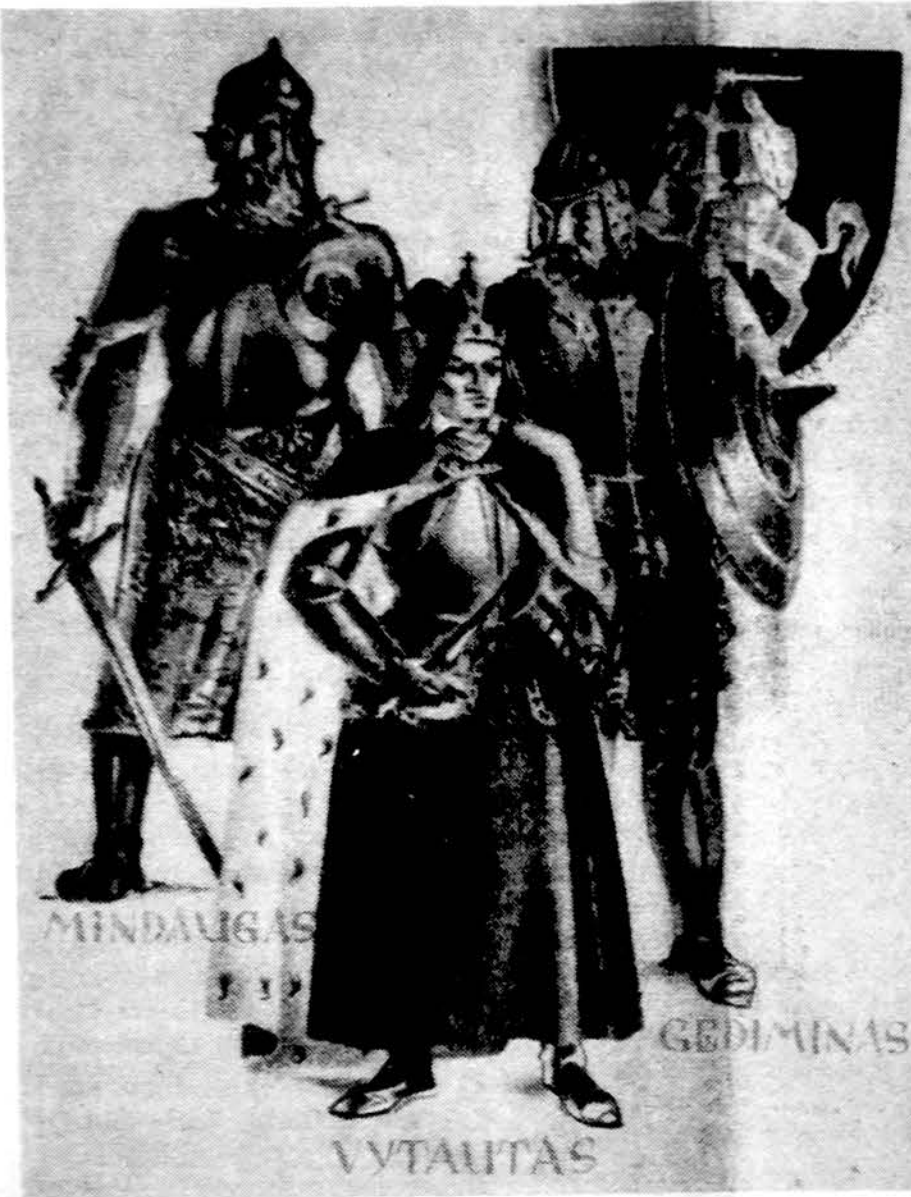
„Iš pračities tavo sūnūs te stiprybę semia!“

Šiuo baigiamas „Aušros“ 50 numeris. Rytų pradžioje spausdinti iš Lietuvos gautą „Aušros“ 51(91) numerį.