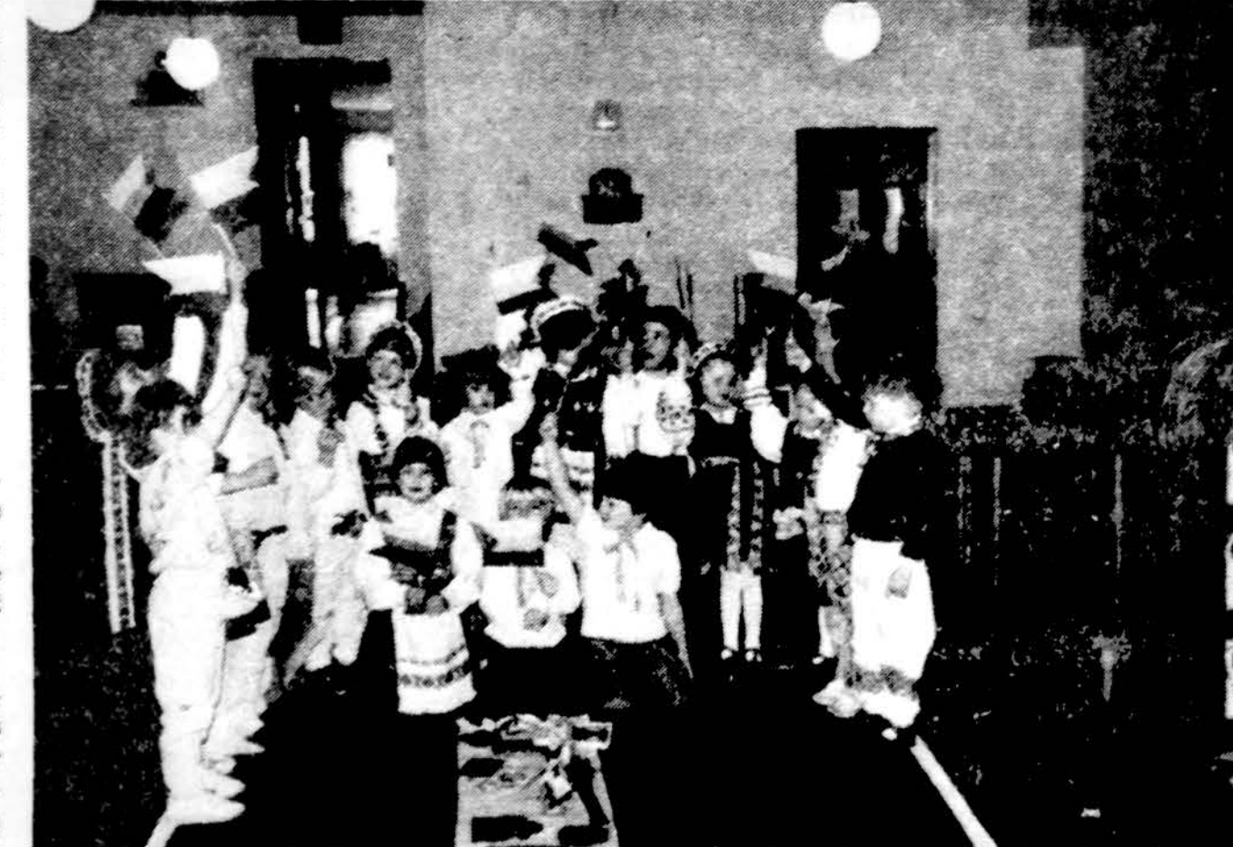
Tegyvuoja Lietuva! Kriauceliūnų vardo Vaikų namelių Vasario 16 minėjimas

Darbo val. nuo 9 iki 7 val. vak. Sėdint 9 v. r. iki 1 val. d.