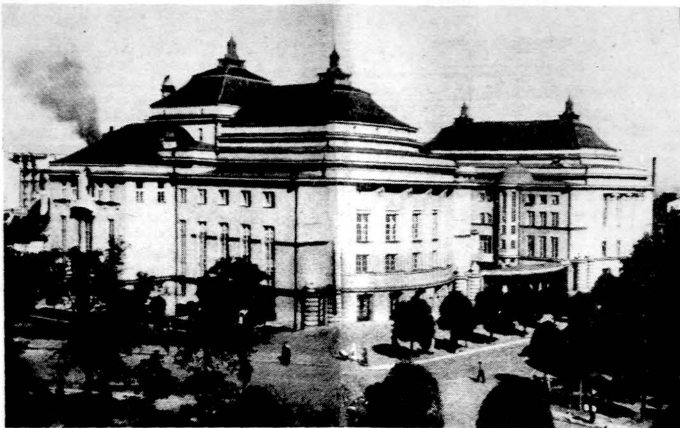
Šiandien Estijos nepriklausomybės šventė. Čia matome Estijos Tautinių Teatrų Tėvų namai, kuriame vykdo Estijos nepriklausomybės iškilmės jos laisvės metais.

— Varšuvoje lenkų komunistų vadai gen. W. Jaruzelski kreipėsi į Lenkijos komunistų partiją, prašydamas būti atviroms kritikai ir kad nesugebantieji vadovauti pasitrauktų iš savo pozicijų, užleisdami jas jaunesniems žmonėms. Jo kalba sekmdienį sukviestiems komunistų partijos nariams niekuo nesiskyrė nuo sovietų Gorbačiovo kalbų.