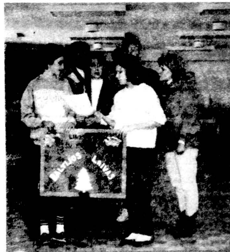
Toronto lietuviams pensininkams kalėdines giesmes gieda „Baltijos“ laivo jūrų skautės.

Toronto „Baltijos“ laivo jūrų skautės, kaip ir kiekvienais metais, gruodžio mėn. aplankė „Vilnius Manor“ lietuvių pensininkų namus. Ten jos giedojo kalėdines giesmes, vaišino senelius pačių keptais pyragaičiais ir smagiai su jais praleido popietę. Aplankytieji pensininkai buvo labai praždiuginti šiuo gražiu jūrų skaučių geruoliu darbe.