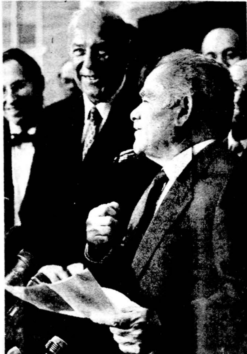
Israelio premjeras Yitzhah Shamir po pasitarimų Valstybės departamente su sekretoriumi George Shultz.