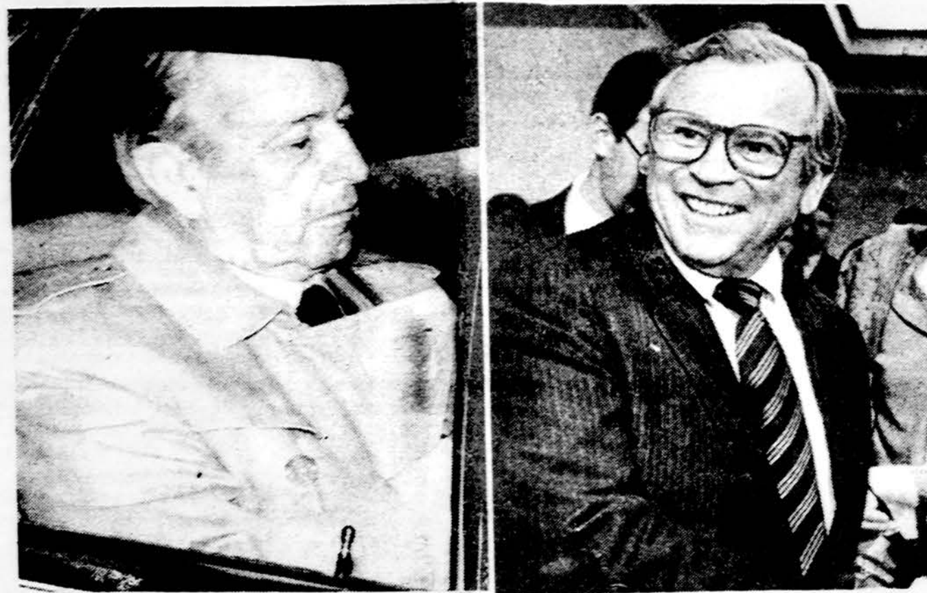
Donald T. Regan, kairėje, išvyksta iš Baltųjų rūmų po savo rezignacijos. Howard H. Baker, Jr., dešinėje, atvyksta į Baltuosius rūmus pasakyti prezidentui, kad jis sutinka perimti Baltųjų rūmų štabo viršininko postą.