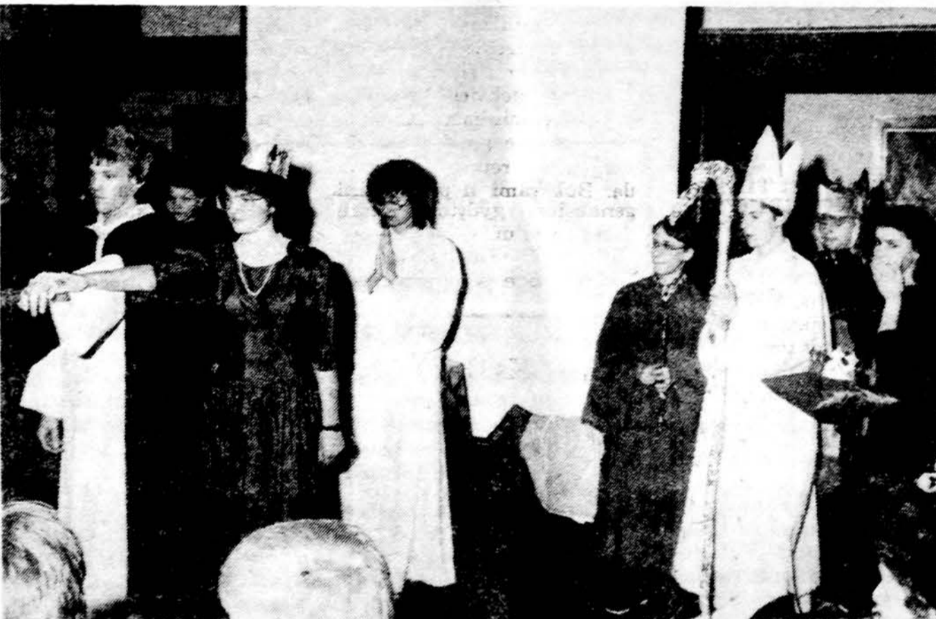
Kr. Donelaičio liuanistinės mokyklos mokiniai atlieka vaidelį „Lietuvos krikštą“ Jaunimo centro Lietuvos Nepriklausomybės sukakties minėjime vasario 16 d.

Astronomai atrado septynias naujas galaktikas viename visatos plote, kuris buvo manomas esąs tuščias. Šios galaktikos unikalios savo didesniu kiekiu energingų dujų negu kitos žvaigždžių grupuotės, kas galį reikšti, kad tose galaktikose formuojasi naujos žvaigždės iš erdvių dujų ir dulkių. Taigi ir šios galaktikos manoma esančios jaunesnės už mūsų Paukščių tako galaktiką, kuri manoma turinti apie 10 milijonų metų. Šie stebėjimai buvo padaryti 1982-1986 m. laikotarpyje su įvairiais optiniais teleskopais Kitt Peak, Arizonoje. Šis plotas yra Bootes žvaigždyno kryptyje ir spėjama, kad jis yra 300 milijonų šviesmečių skersmens. Naujai atrastosios galaktikos yra maždaug lygiai išdėstytos tame plote, maždaug to paties dydžio kaip mūsų, bet neturi spiralinių sparnų, būdingų kitoms galaktikoms.