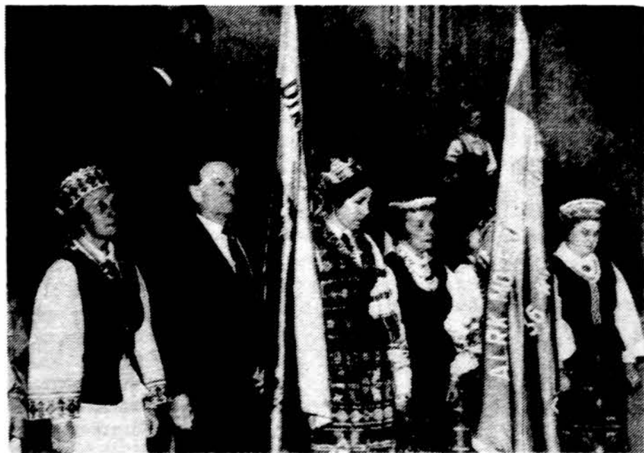
Vasario 16-tosios minėjime Clevelande.

(Atkelta iš 3 psl.) Sąjunga pagamina maždaug tik pusę bendrojo nacionalinio produkto vienam gyventojui, lyginant su Amerika. To sovietų produkto struktūra labai nepalanki žmogui, nes ji yra mašininė-karinė, lyginant su amerikiečių, kurių gamyboje žymiai didesnė gaminių dalis yra skirta kasdieninės gerovės reikalams. Tuo tarpu nepriklausomybės laikais pagrindinė Lietuvos, Latvijos ir Estijos gaminamo nacionalinio produkto dalis buvo skirta gerovei. Todėl tos valstybės, nedalyvaudamos Maskvos ginklavimosi ir skverbimosi pasaulin progrose, net turėdamos mažesnę gamybinį potencialą negu dabar, turėjo žymiai aukštesnį gyvenimo lygį, negu šandien turi, ir neskurdo dėl masinių nepakankamumų rinkoje. O už bendrą žmonijos techninę pažangą, juo labiau už sovietų strateginiais tikslais nutiestus asfaltus, už išplėstus aerodromus ir uostus, už kolonizavimo tikslais pastatytas įmones ar už išaugusius dėl prievartos ir koloninės politikos miestus — lietuvių, latvių ir estų tautos Maskvai nuopelnų niekad neužskaitys, nes šio pobūdžio įsibrovimai į Pabaltijo tautų gyvenimą ir aplinką buvo neleistinai grubūs ir dirbtinai audringi, kolonistiniai. Valstybinė nepriklausomybė tautai yra didelė brangenybė, nes ji apima viską, o ne vien šiltą vandenį buičiai, mašinų apsupty ir kitus bedvasius dalykus, kuriais, kaip ir naciai, puikuoja užkariautojai iš Maskvos ir jų pakalikai.