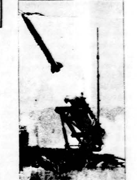
Amerikos naujoji Patriot raketa, sekmingai išbandyta, kuri taikliai „nužudo“ atlekiančią priešo raketa.

Jis taip pat sakė, kad Maskva nori griežtiau patikrinti taisyklių Amerikoje ir NATO valstybėse ir kad ten būtų fiziškai sunaikintos raketos, kartą su atomineis užtaisais. Specialiai jis minėjo, kad sovietai nori turėti teisę tikrinti Amerikos privačius fabrikus, kurie turi kontraktus su vyriausybe, kad jie slaptai negamintų ginklų, kurie gal-