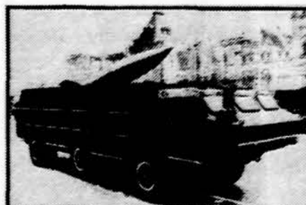
Sovietų SS-21 raketa, kaip konvencionalių ginklų dalis.