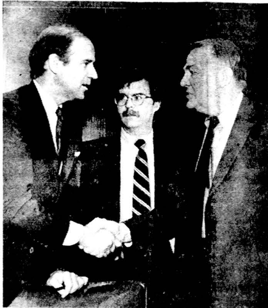
Generalinis Amerikos prokuroras Edwin Meese III, dešinėje, yra sveikinamas Senato Teisingumo komiteto pirmininko sen. Joseph R. Biden, Jr., prieš jo apklausinėjimą Senate. Kas stovi centre — nežinoma.