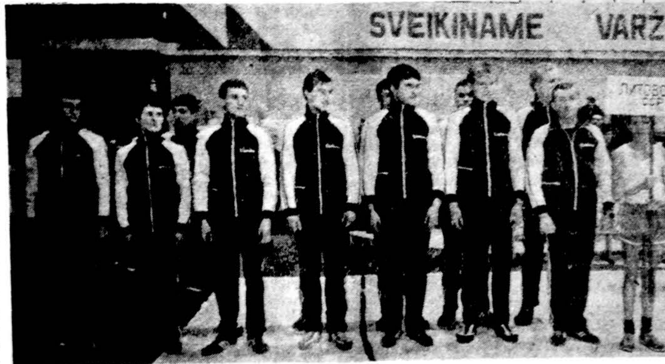
Lietuviai boksininkai per Sovietų Sąjungos bokso pirmenybių atidarymą vasario 6 d. Kauno sporto halėje.