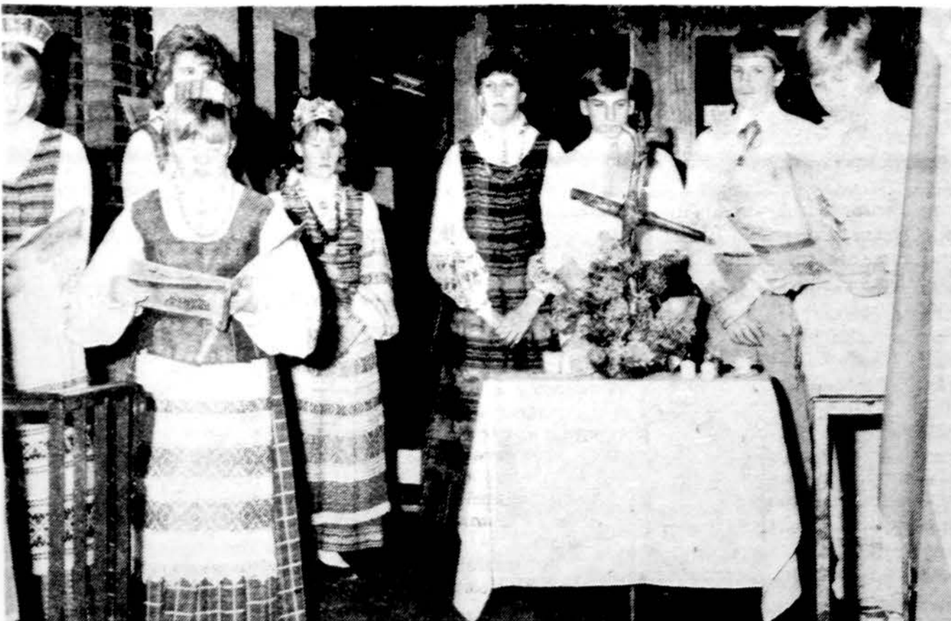
Kr. Donelaičio aukštesniosios mokyklos mokiniai, atlikę Jaunimo centro Vasario 16-tosios minėjimo meninę programą vasario 16 d. Montażas – „Kryžių kalno naikinimas“.

Spalio 4 d. 2 val. po pietų Šv. Kryžiaus katedroje Bostone Šv. Mišios, atnašaujamos kardinolo Bernard Law, minint Lietuvos krikšto sukaktį, o 6 val. vakaro – iškilmingas banketas Lantana restorane Randolphe.