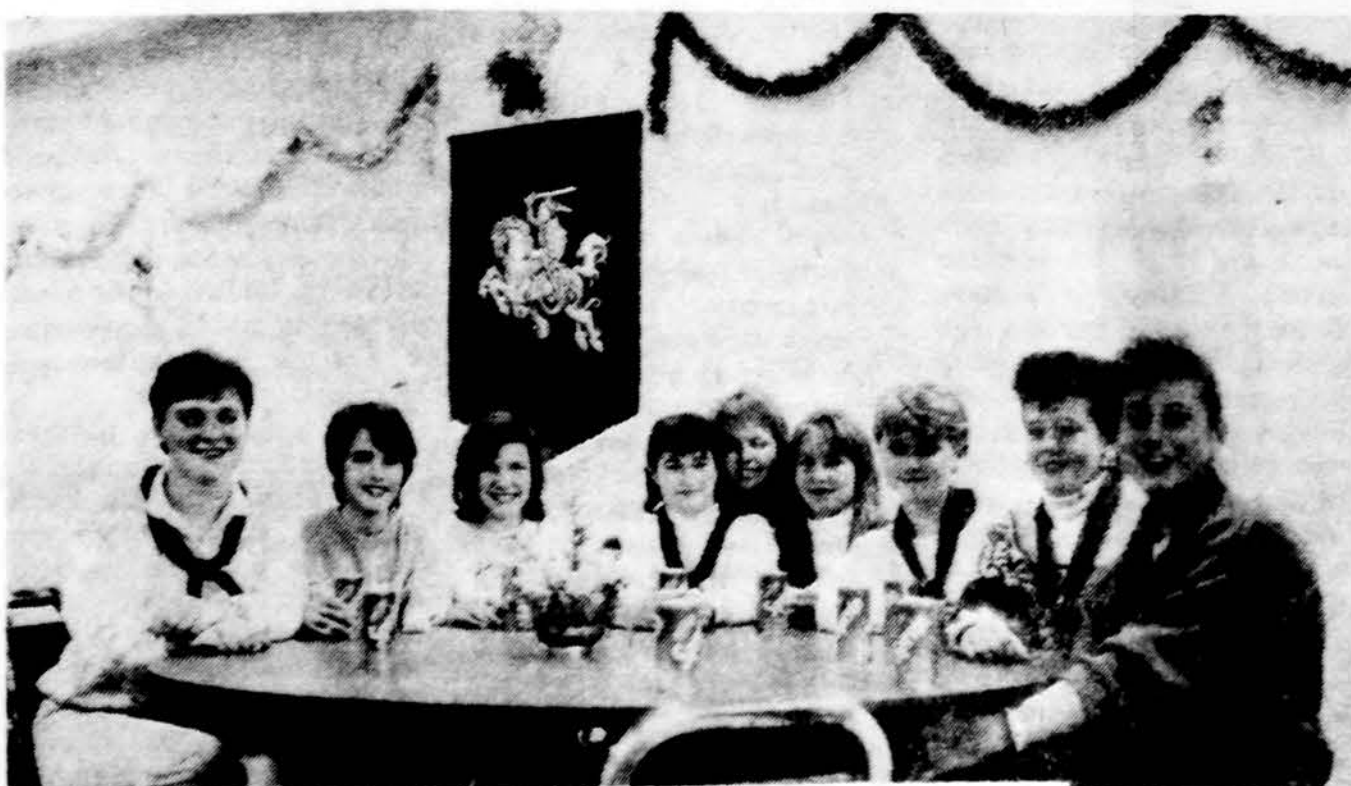
„Baltijos“ laivo Toronte jūrų skautės posėdžiauja.