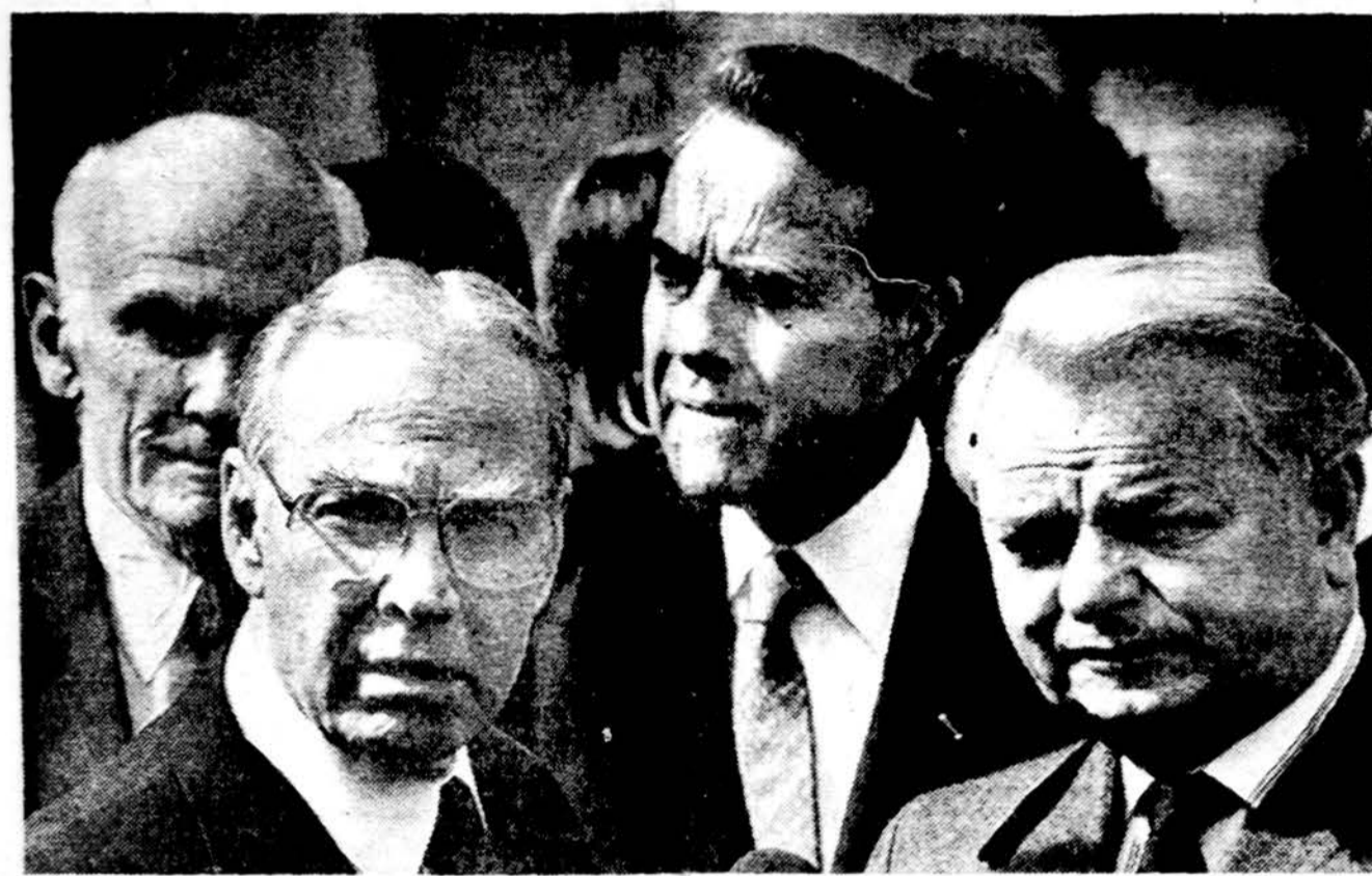
Kongreso vadai po pasitarimo su prez. Reaganu. Iš kairės sen. Alan Cranston, Atstovų rūmų speakeris Jim Wright, sen. Bob Dole ir sen. Robert C. Byrd.

Sovietų Sąjungoje dabar skelbiamos vadinamo „persitvarkymo“ reformos, rašo straipsnyje Henry Kissinger, kai kuriuose Vakarų sluoksniuose vėl sukeliama nuosėda nenumaldoma svajonė, kad sovietinė sistema galinti atsiverti vakarietiškos sąvokos demokratinėm vertybėm. Apokryfai ir išradingi sovietų valstybės vadovai, betgi, rašo Henry Kissinger, savo reformomis anaipol nesiekia tų