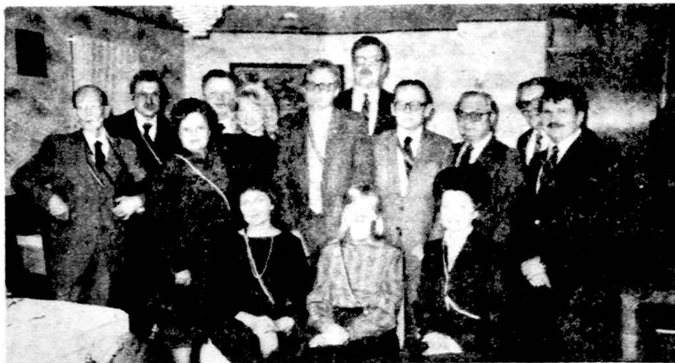
Vydūno Jaunimo fondo valdyba ir tarybos prezidiumas.

Visi paviljonai buvo gražiai įruošti ir juose buvo gausiai įvairių rankdarbių, visokių sujų pyragų, riestainių ir kitokių gerybių. Patogiai įsitaisę tiekimo skyriaus vedėjas s. J.