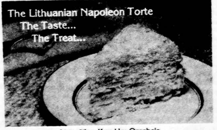
The Lithuanian Napoleon Torte The Taste... The Treat...

LAI DOTUVIŲ DIREKTORIAI 1446 South 50th Avenue Cicero, Illinois Telefonas — 652-1003