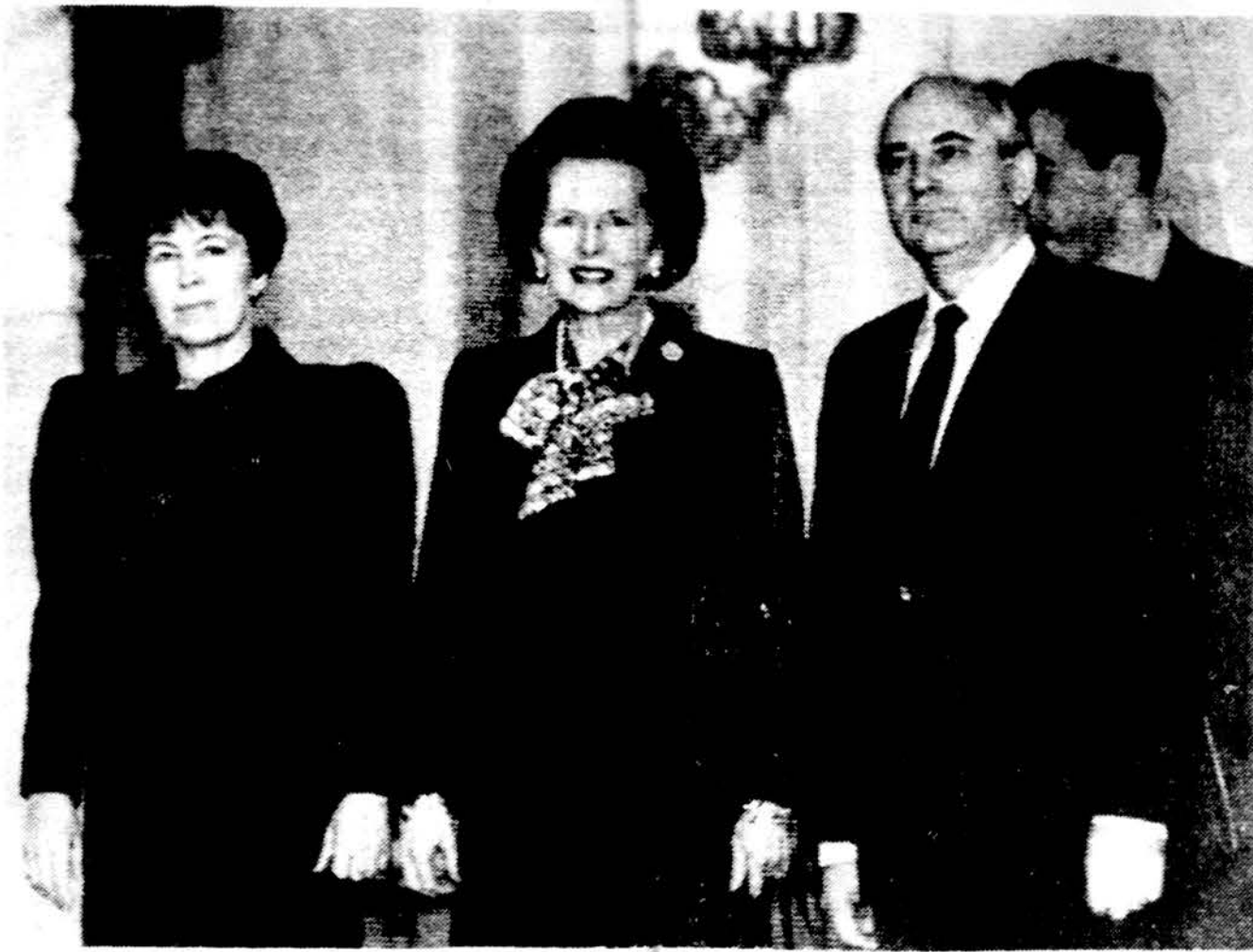
Britanijos ministrė pirmininkė Margaret Thatcher lankosi Sovietų Sąjungoje ir čia pozuoja spaudai su Michailovu Gorbačiovu ir jo žmona Raisa Kremljuje. Čia ji pasakė, kad pasaulio progresas tegali būti padarytas tik tada, kai bus laikomasi žmogaus teisių ir paleisti visi kaliniai iš sovietų kalėjimų ir psichinių ligoninių, kurie ten laikomi už politinius ir religinius įsitikinimus.

pašaukimo? Nejaugi vis nusileidžiant ir nusilenkiant prieš visokius neteisingumus, priešingus Bažnyčiai įstatymus ir norus nieko neveikti? Nejaugi išsižadėti brangiausių idealų, rūdyti kur susirietus ir susitraukus iš baimės? Jei taip elgtumės, tai susilauktume to, kad kokią dieną mums uždraustų ir katalikais būti. Ne, anaipol! Turim eiti narsiai ir drąsiai keliu, kurį mums rodo Dievas, ten, kur Dievo Dvasia mus veda ir skatina eiti, į jokiais kliūtis neatsižvelgiant ir nieko nenuogąstaujant. Jei pilni Dievo Dvasios būsim, pagaliau viską turėsime nugalėti. Dvasios nei pančiai nesugebės surakinti, nei kalėjimai neužkals, nei ištrėmimo nesulaikys. Uždek tik, Viešpatie, mūsų širdis Tavo meilės ugnimi!“ (Pabaiga)