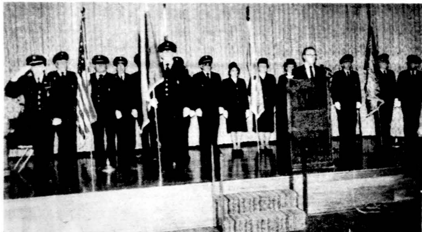
Lietuviai šauliai Rockforde mini Vasario 16-tąją dieną.