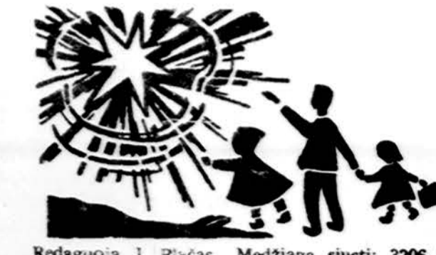
Redaguoja J. Pliacas. Medžiagą siūsti: 3206 W. 65th Place, Chicago, IL 60629

Autobusai iš Marquette Parko išvyks nuo 69-tos ir Washtenaw gatvių šeštadienį 6 v.v., o sekmadienį 1:30 val. p.p. Autobusai išvažiuos iš Marquette Parko sustos Brighton Parke prie bažnyčios, 44 ir Californijos gatvių sankryžoje ir paimeis keleivius, jei tokių bus. Po spektaklių vel visus parves į tą pačią vietą. Važiuojantieji savo maminomis, jas gali pastatyti rytu pusėje už mokyklos didžiulėje sporto aikštelyje. Įvažiuojamas pro 24 ir 25 gatvių vartus. (pr.)