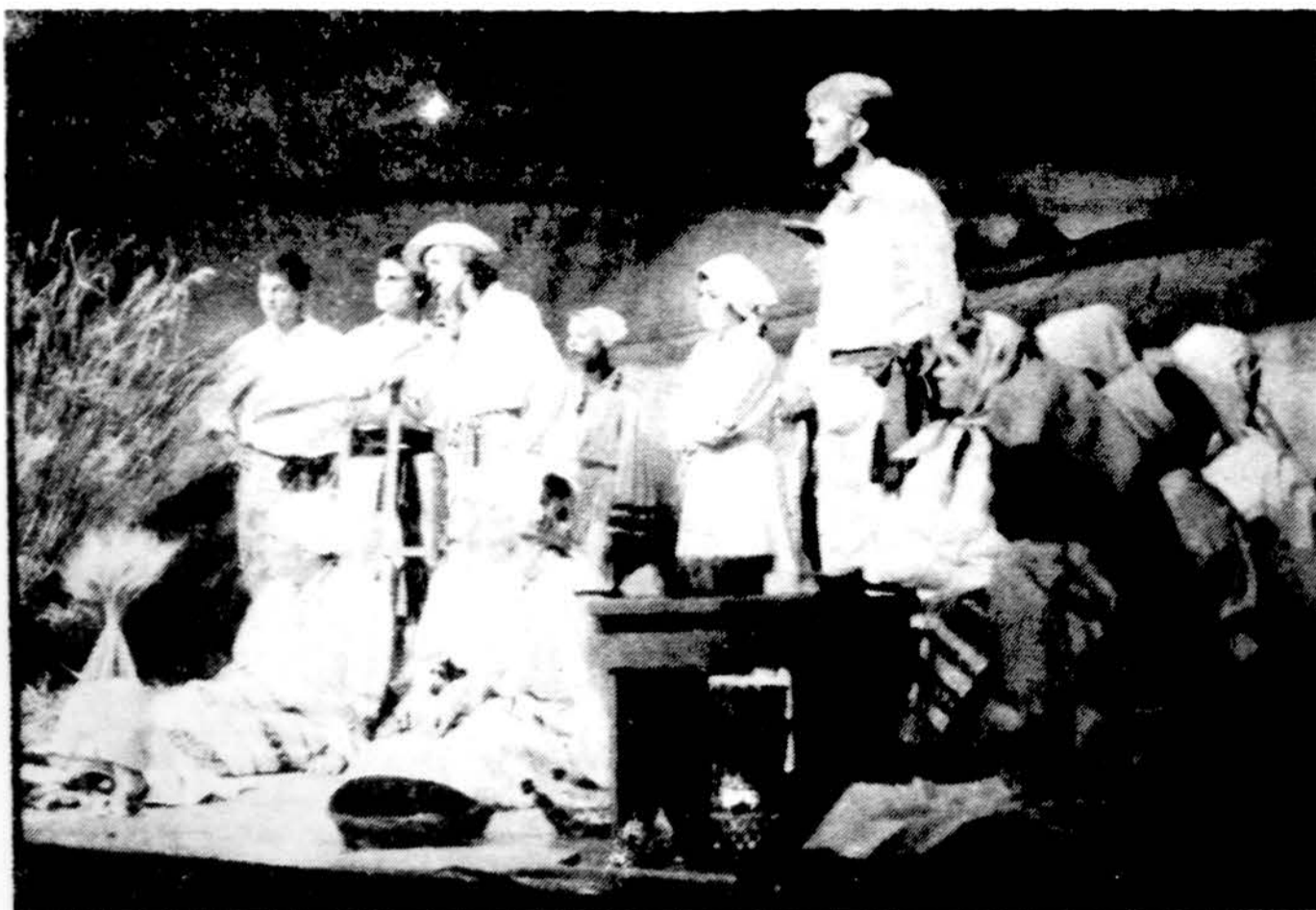
„Bekit, bareliai“... Rugiapjūtės šventė Toronte, kur atlieka Pedagoginio Lituanistikos instituto studentai kovo 28 d.