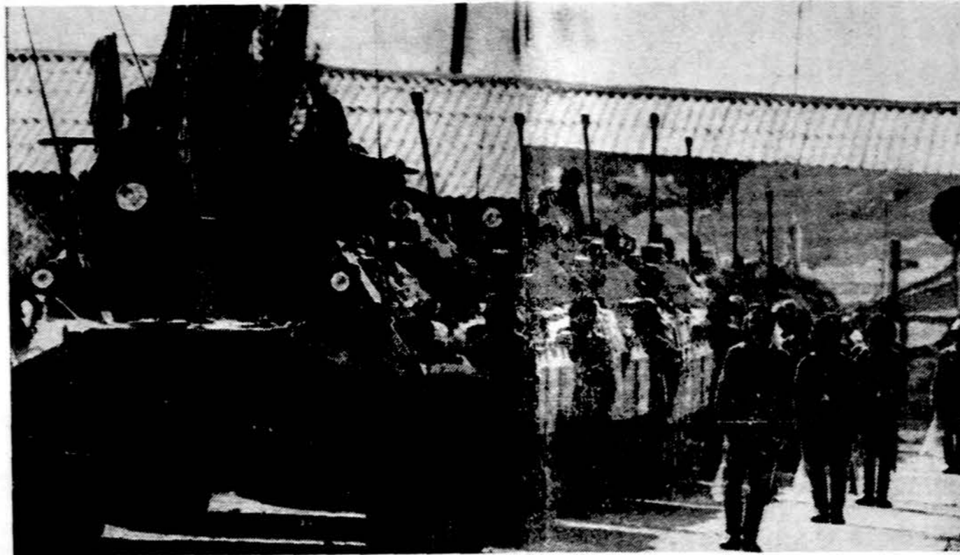
Sovietų Sąjungos tankai tebeokupavę Afganistaną.

Sen. Howell Helfin pasakė reporteriams, kad Poindexter gali labai daug paaiškinti, kas buvo daroma su Irano ginklais. Jis bus labai stropiai klausinėjamas, nes jis turėjo tokia poziciją, kuris turėjo viską žinoti, įskaitant ir prezidento sutikimą parduoti ginklus. Komisijai ypač rūpi sužinoti, kokie vyko pasikalbėjimai tarp jo ir prezidento apie ginklus. Prieš tai Poindexter atsisakė atsakyti į klausimus, kad nepakenktų sau pačiam.