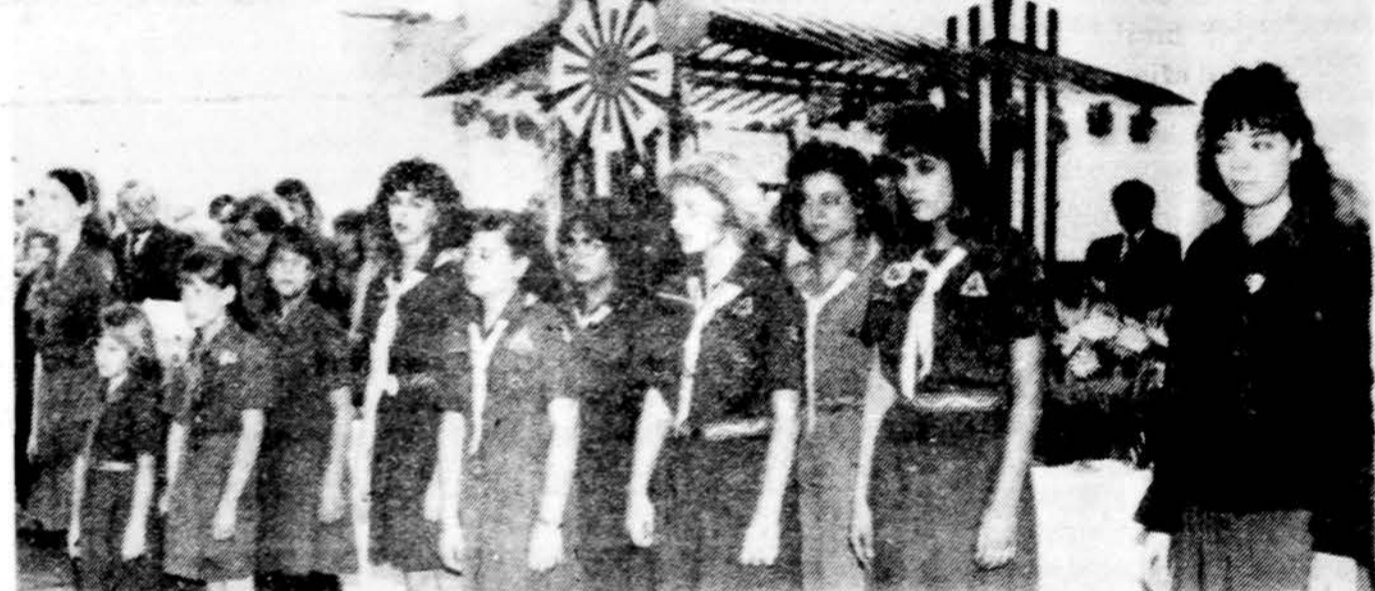
Clevelande Kaziuko mugė atidarant.