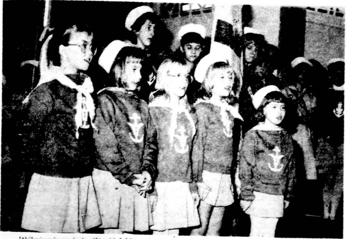
Iškilmingoje sueigoje eilėraščių deklamuoja „Nerijos“ tunto „Ventės“ laivo ūdrytės.