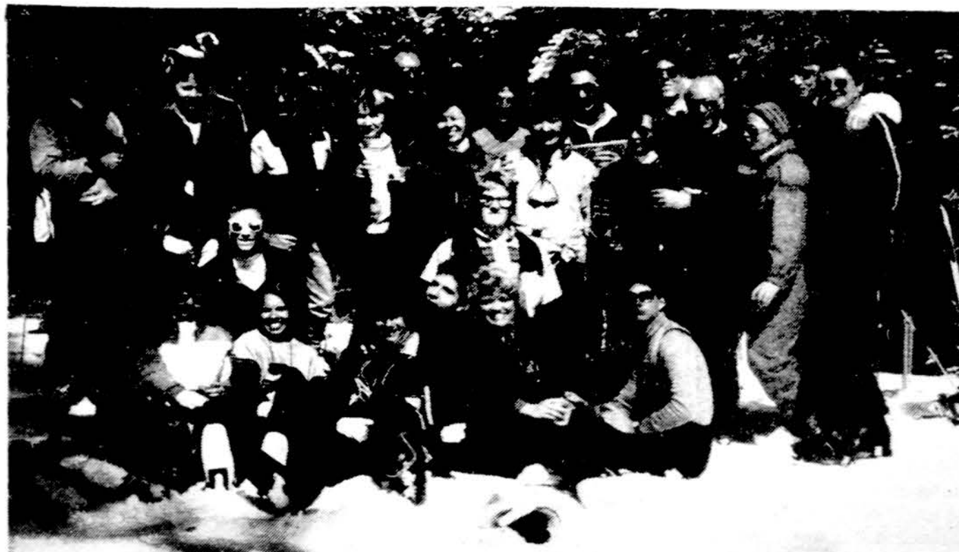
Lietuviai piknikauja Breckenridge, Colo., su lietuvišiais svečiais iš Seattle, Wash., ir Chicago.