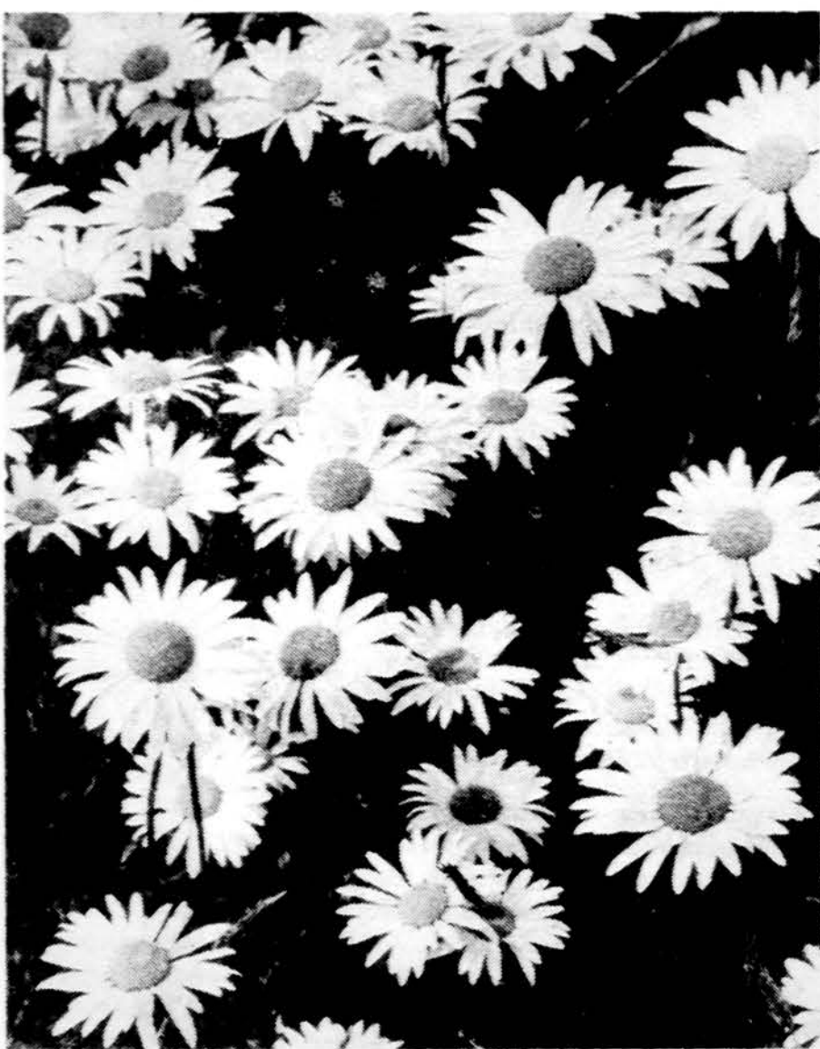
Tau, mamyte, šios gražios gėlės, Lietuvos laukų ramunėlės.

Isteigtas Lietuvių Mokytojų Sąjungos Chicago skyriaus