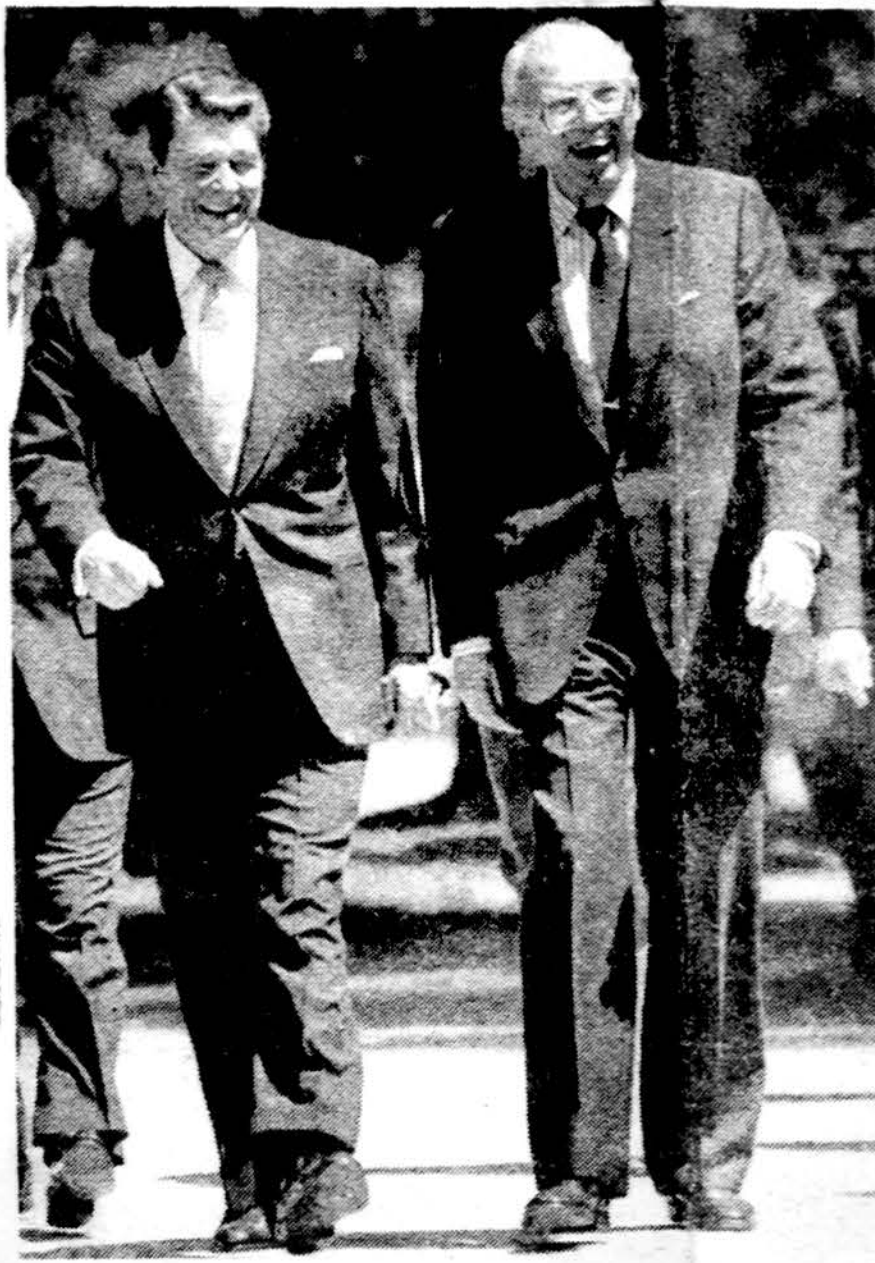
JAV prezidentas Ronald Reagan ir CIA direktorius William J. Casey 1984 m., kuris mirė praėjusį pirmadienį. Jis buvo 74 m. amžiaus. Daugelio politikų vadinamas aukštų idealų vyrų, patriotu ir nuolat dirbusiu, kad Amerika būtų stipri ir saugi. Jis buvo griežtai nusistatęs prieš komunistus ir už efektyvią paramą Nikaragvos laisvės kovotojams.

Oficialūs pareigūnai sako, kad sovietai ir kitur Amerikoje panašiu būdu renka žinias. Ypač jiems daug naudos duoda San Francisco trumpųjų bangų stotis, į kurią įsiterpia su klausymo aparatais. Telefoniniai pasikalbėjimai keliauja trumposiomis bangomis, satelitų pagalba arba žemės laidais. Sovietai juos gali Kuboje esančiais elektroniniais specialiais aparatais įjungti į savo sistemą. Dabartinė sovietų ambasada Washingtono yra apsupta aukštais pastatais, ir tai sumažina klausymo aparatų veikimą.