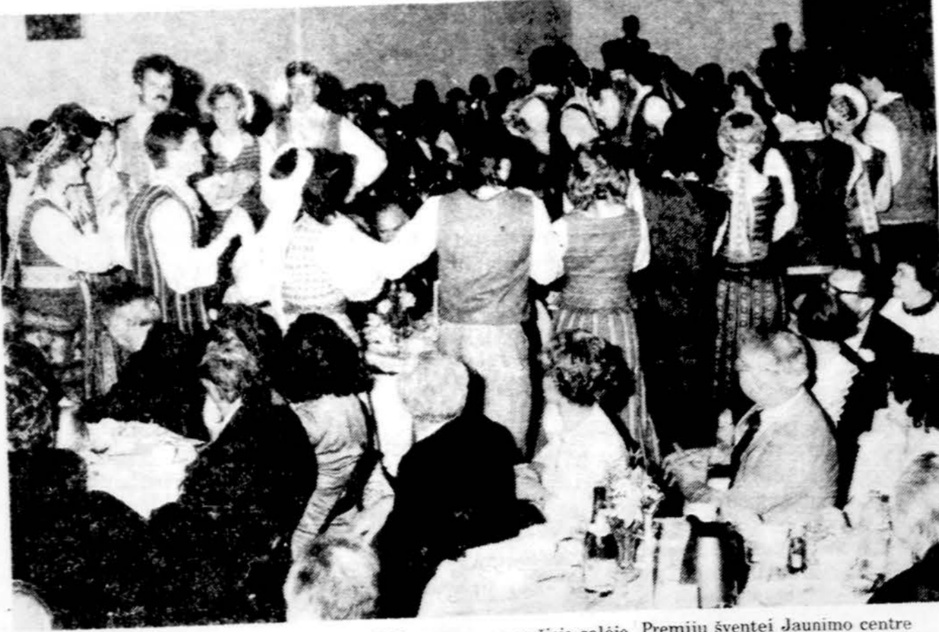
„Grandies“ tautinių šokių ansamblis atlieka programą patioje salėje Premijų šventei Jaunimo centre vykstant.