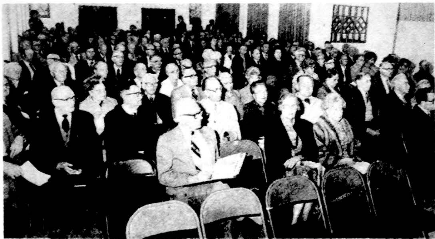
„Kasos“ susirinkimo dalyviai Jaunimo centre gegužės 3 d.