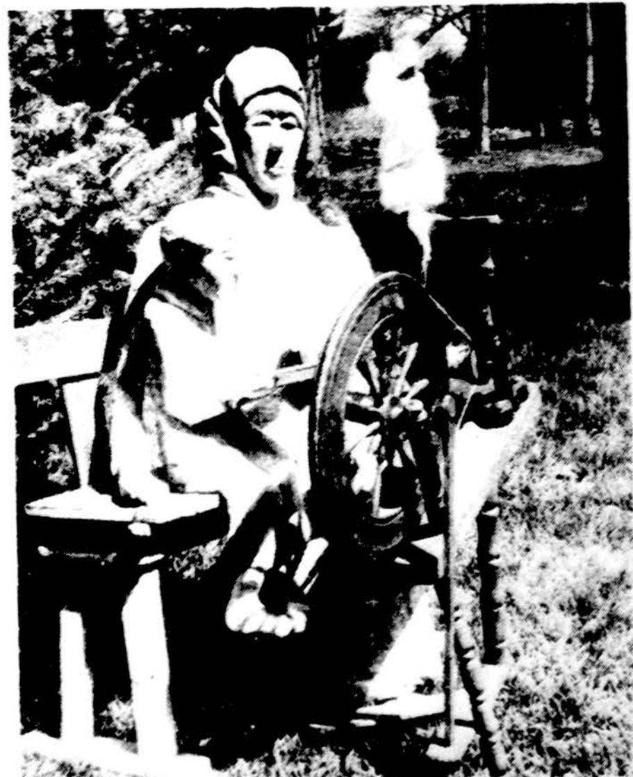
A. Grigaičio skulptūra „Vargu mokykla“ Nuotr. A. Grigaičio