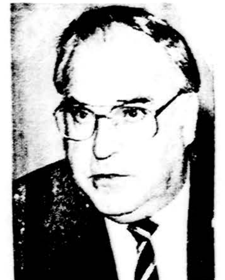
Kancleris Helmut Kohl

Helmut Kohl dar kartą pakartojo, kad išvežimas trumpesniųjų raketų paliktų Vakarų Europa Sovietų Sąjungos galiai, nes ji turi žymiai persvarą konvencionaliųjų ir cheminių ginklų srityje. Jis sako, kad yra netoleruotina palikti Europą tokioje būklėje. Vakarų Vokietija yra vienintelė NATO šalis, kuri priklauso 300 mylių raketų kategorijai.