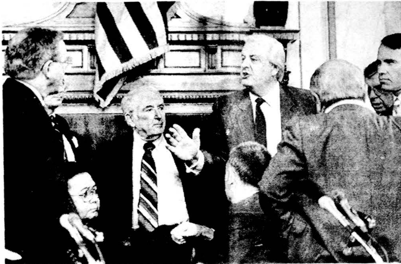
Atstovų rūmų ir Senato bendro komiteto nariai Irano – Contras apklausinėjimų pertraukos metu. Iš kairės senatoriai Warren B. Rudman ir Daniel K. Inouye, sedi. Senato komiteto vadas, ir kongresmenai Peter Rodino, Lee Hamilton, sedi. Atstovų rūmų komiteto vadas, Henry Hyde, Dante Fascell, Ed Jenkins ir Jim Courter.