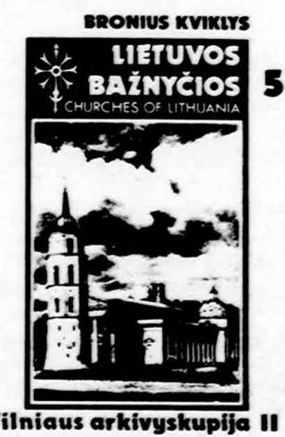
Vilniaus arkivyskupija II

Užsakymus siųsti: DRAUGAS, 4545 W. 63rd St., Chicago, IL 60629