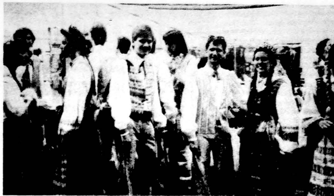
Los Angeles Lietuvių Bendruomenės ansamblio „Spindulys“ šokėjai, sekmingai pasirodė XII Tarptautiniame festivalyje Las Vegas, Nevadoje, gegužės 3 d.