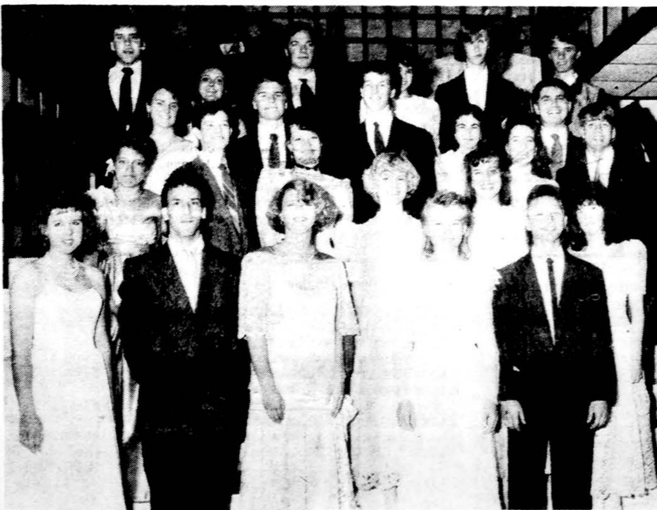
Šių metų abiturientų išleistuvės ir supažindinimas su lietuviška visuomene. Supažindinimą rengė Lietuvos moterų klubų federacijos Chicago skyrius.