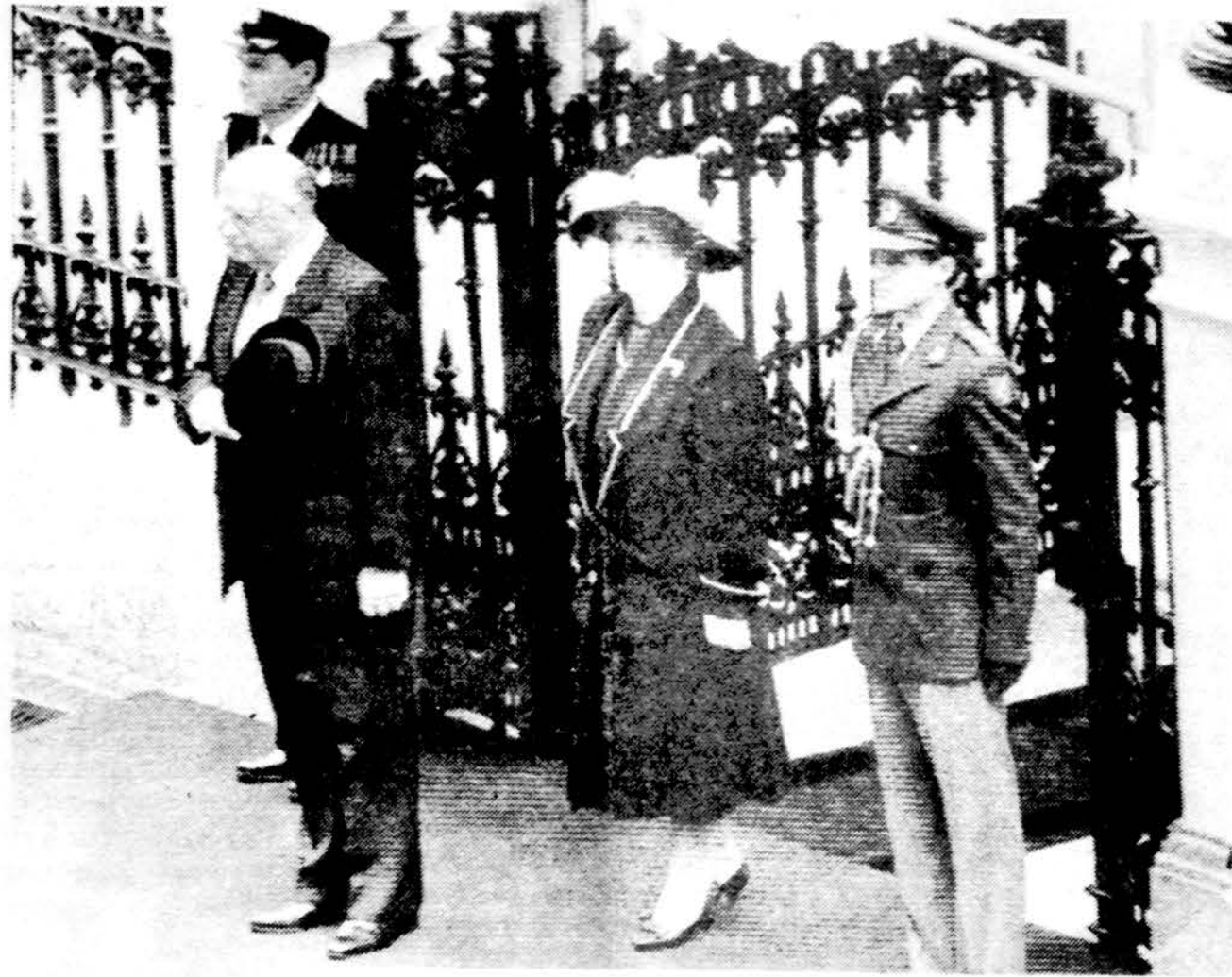
Pietų Afrikos prezidentas P. W. Botha parlamento atidarymo iškilėse Cape Town mieste. Šalia jo žmona Elize.

cesai, vykstantys jūroje“. Profesorius pažymėjo, kad „dėmių išsidėstymas priklauso ir nuo vandens užterštumo. Džiugu, kad pastaraisiais metais kova su Baltijos teršėjais tapo aktyvesnė. Teigiama įvertinimo, pavyzdžiui, užsienyje susilaukė sprendimas nutraukti netobulos konstrukcijos naftos gavybos bokšto statybą prie Kuršių Nerijos. Bet liko dar nemaža skubiai spręstina problemų, susijusių su pramonės atliekomis, kurios patenka į jūrą. Išsivysčiusių Europos valstybių apsuptyje esančiai Baltijai gresia ekologinės pušiausvyros suirimo pavojus. Baltija — mūsų bendra jūra, bendras rūpestis“. — Washington reikiamas nepasitenkinimas, kad Jungtinių Tautų Saugumo Taryboje, kurioje yra penki nuolatiniai nariai, Amerika negalėjo prarasti pasiūlymo, kad būtų paskelbtas ginklų embargo Iranui. — Illinois respublikonai praneša, kad viceprez. George Bush rinkiminei kampanijai reikia surinkti vieną milijoną dol. Šioje valstijoje. — Chicago je Cook apskrities prokuroras Richard M. Daley nusprendė kandidatuoti trečiam terminui.