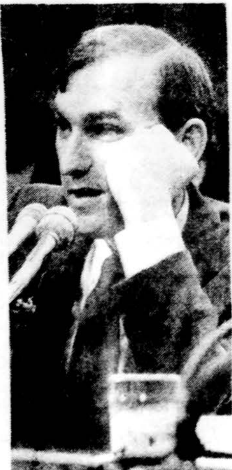
Valstybės departamento asistentas Elliot Abrams liudijimo metu.

Kongreso komiteto kai kurie nariai pasakė, kad jie visai nebeapsitiki, ką sako Abrams. Kongr. Jack Brooks iš Texas pavadino jį melagiumi. Bet ir Kongreso advokatu klausimus Abrams atsakė labai atsargiai, sakydamas, kad jis nesistengė iš pulk. Oliver North sužinoti detalių, kuris vedė Contras aprūpinimą. Abrams yra teisininkas, baigęs Harvardo universitete teisę. Vienu metu sekr. Shultz prašęs jį, kad jis užrašytų viską, ką kalbasi su pulk. North.