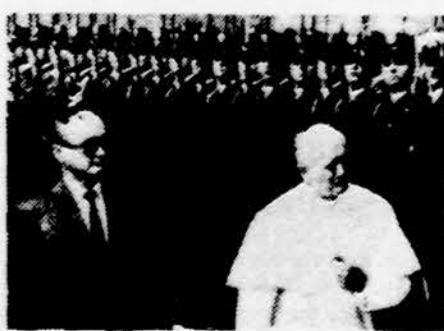
Jaruzelskis lydi popiežių pro garbės sargybą.

Varšuva. – Popiežius Jonas Paulius II pirmadienį atvyko vienos savaitės vizitui į savo gimtąjį kraštą. Popiežius, kalbėdamas Varšuvos karališkoje pilyje, tuoj ragino Lenkijos vyriausybę respektuoti žmogaus teises, žmogiška oruma ir leisti visiems savo piliečiams dalyvauti viešame valstybės gyvenime. Čia popiežius klausėsi Lenkijos komunistų partijos pirmininkas ir prezidentas gen. W. Jaruzelski su kitais vyriausybės nariais ir visa eilė Romos Katalikų Bažnyčios dignitarių. Popiežius kalba buvo daugiau diplomatiška, negu, kad kai jis lankėsi čia 1983 m., kai kraštas buvo vos beatsigaunęs po karo stovio įvedimo.