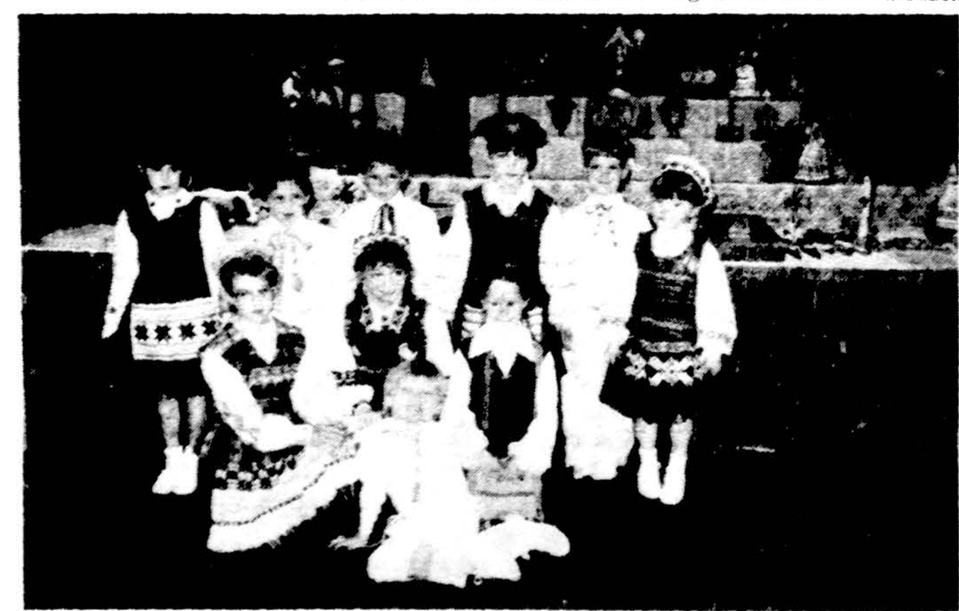
Liepsnelės ir giliukai prie lietuvių paviljono Omahos miesto etniniame festivalyje. Šie jaunieji skautukai žavėjo žiūrovus tautiniais šokiais.