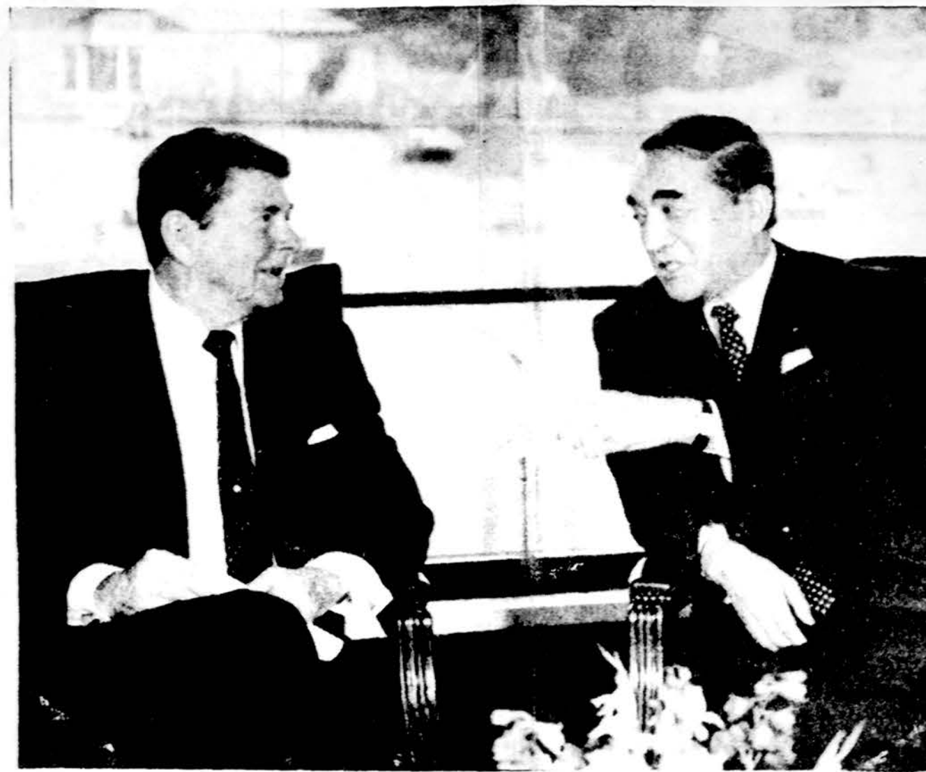
Prezidentas R. Reagan ir Japonijos ministras pirmininkas Y. Nakasone privatus pasitarimo metu Venecijoje, Italijoje. Japonai su pastebimu pasitenkinimu sutiko prezidento paskelbtą tarifų mokesčių sumažinimą elektroninėm prekm iš Japonijos.

Jaruzelskis kalbėjo prieš popiežių, tardamas, kad dabar Lenkija pamažu eina į tautinę vienybę ir susitaikina. Bet jis priminė, kad Solidarumas neatneš nieko gero Lenkijai. Vėliau popiežius su Jaruzelskiu turėjo 75 minučių pasikalbėjimą.