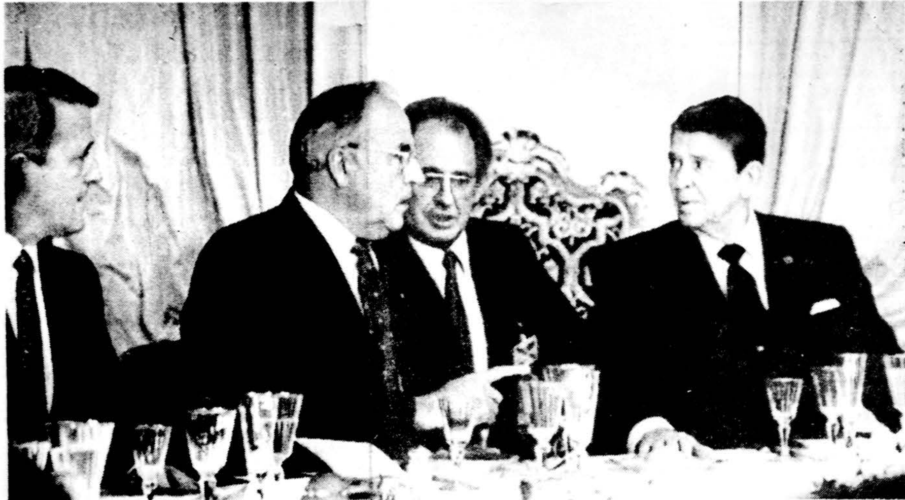
JAV prezidentas Ronald Reagan kalbasi su Vokietijos kancleriu Helmut Kohl, antruoju iš kairės, ir Kanados ministru pirmininku Brian Mulroney, kaireje, pietų metu Venecijoje viršūnių ekonominėje konferencijoje. Kas yra šalia prezidento — nežinoma.

—Seoul Pietų Korėjos prezidentas Chun Hwan pasirinko savo įpėdinį buvusį klasės draugą karo akademijoje ir šiuo metu valdančios partijos pirmininką Tho Woo, kai baigsis jo terminas vasario mėnesį.