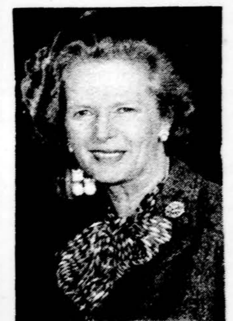
Britanijos ministrė pirmininkė Margaret Thatcher pertvarkė savo ministerių kabinetą.

Užsienio reikalų ministriu ir toliau lieka Geoffrey Howe, o finansų ministriu taip pat ir toliau bus Nigel Lawson. Kitose pozicijose asmenys keičiasi. Iki šiol Konservatorių partijos vadu buvo Norman Tebbit, kuris nebebus kabinete ir vėliau žada pasitraukti ir iš partijos vadų. Konservatoriai Atstovų rūmuose dabar turi 101 asmenį daugumą.