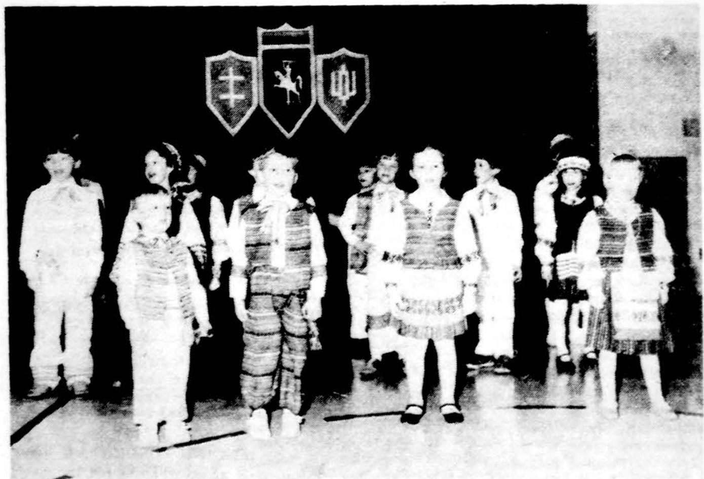
Lemonto Maironio lit. mokyklos darželio mokiniai deklamuoja eilėraščius Vasario 16-tos minėjime.

1446 South 50th Avenue Cicero, Illinois Telefonas – 652-1003