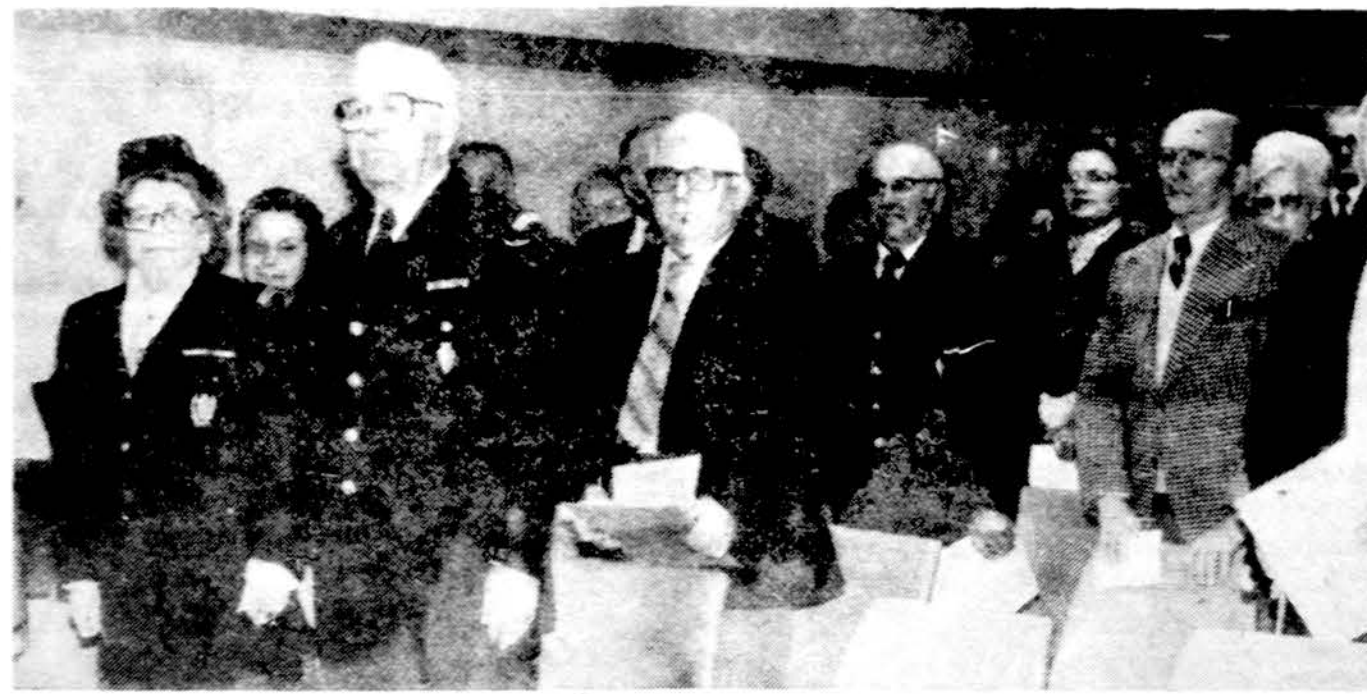
„Zalgirio“ šaulių kuopos Clevelande metiniame susirinkime atsistojimu ir susikauptimo minute pagerbiami mirusieji nariai.